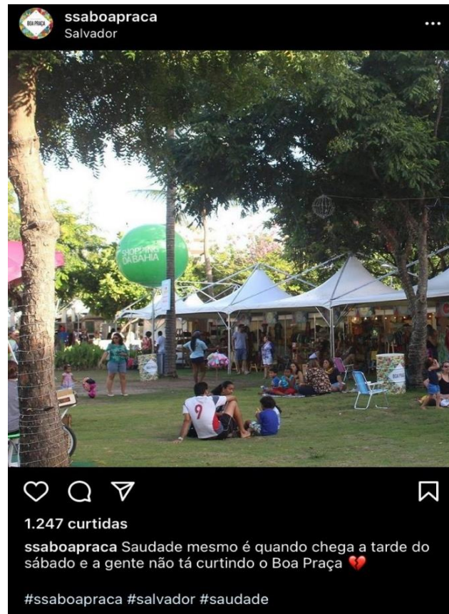
Figura 2 - Realização de edição do Salvador Boa Praça, na Praça Ana Lúcia Magalhães, localizada na Pituba, bairro de classe média/alta, com moradores frequentemente brancos.

O evento se constitui sobre uma ambiência de fruição estética (Vedana, 2013), com organização e sofisticação (Coité, 2020), contando com expositores de gastronomia já consolidados e novos empreendedores do ramo, bem como produtos de artesanato e vestuário relacionado ao capital cultural de classe média e alta (Bourdieu, 2007).