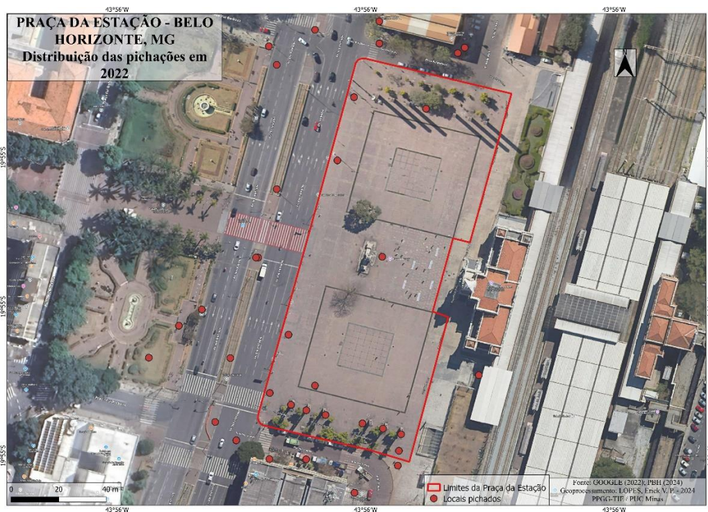
Mapa 3 – Distribuição das pichações na Praça da Estação em 2022

Em Lille, na Place de la Nouvelle Aventure (mapa 4), localizada no bairro pericentral de Wazemmes, tendo como limites as R. Place Nouvelle Aventure, Léon Gambetta, des Serrazins e Parv. de Croix, com a extensão de cerca de 2,3 mil m 2 , tem-se 236 pichações (88,6% na Praça e 11,4% aos seus arredores), com 99,2% de marcações de indivíduos e grupos por disputas territoriais e 0,8% políticas; 65,3% com uso de canetões, 30,8% de spray e 2,4% de estêncil; 84,3% no estilo dos EUA e 5,0% de grafite; com 3,8% de sobreposições; e, 8,5% com presenças de grupos; tendo-se também praticantes e grupos de outras localidades, como os bairros de Croix, Fives e Lambersart, além de terem alfabetos e grupos brasileiros (principalmente paulistas e mineiros). Ressalva-se que as pichações se encontram mais presentes na porção sudoeste/leste da Praça, pela maior presença de estabelecimentos e movimentos de pessoas.