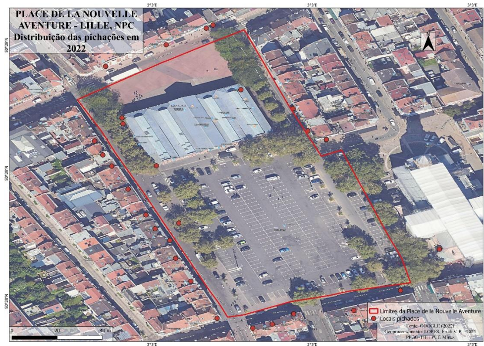
Mapa 4 – Distribuição das pichações na Place de la Nouvelle Aventure em 2022