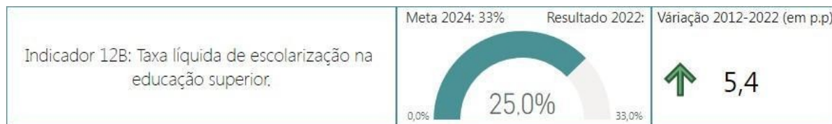
Tabela 2 -Indicador 12B: Taxa Líquida de Escolarização na Educação Superior

A Taxa Bruta de Matrículas na Graduação reflete a relação entre o número total de estudantes matriculados na educação superior (em todos os níveis) e a população na faixa etária adequada para ingresso nesses cursos. Este indicador é fundamental para monitorar o acesso quantitativo à educação superior.