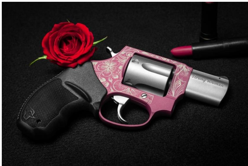
Figura 2 - Revólver Taurus