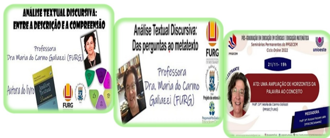
Figura 2: Vídeos selecionados para a atividade avaliativa

Mediante o exposto, nesse momento destinaremos esforços em contextualizar os movimentos que estruturaram a segunda atividade avaliativa, referente a fragmentação dos vídeos. Foram selecionados três vídeos, respectivamente intitulados: 1) "Análise Textual Discursiva: entre a descrição e a compreensão" 4 , 2) "Análise Textual Discursiva: Das perguntas ao metatexto" 5 e 3) "ATD: uma ampliação de horizontes da palavra ao conceito" 6 , identificados respectivamente como vídeos 1, 2 e 3, na Figura 2 na sequência: