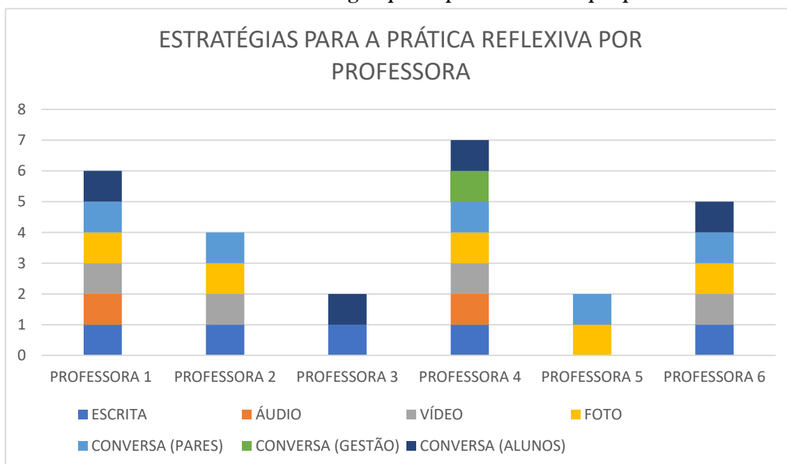
Gráfico 3: Estratégias para a prática reflexiva por professora