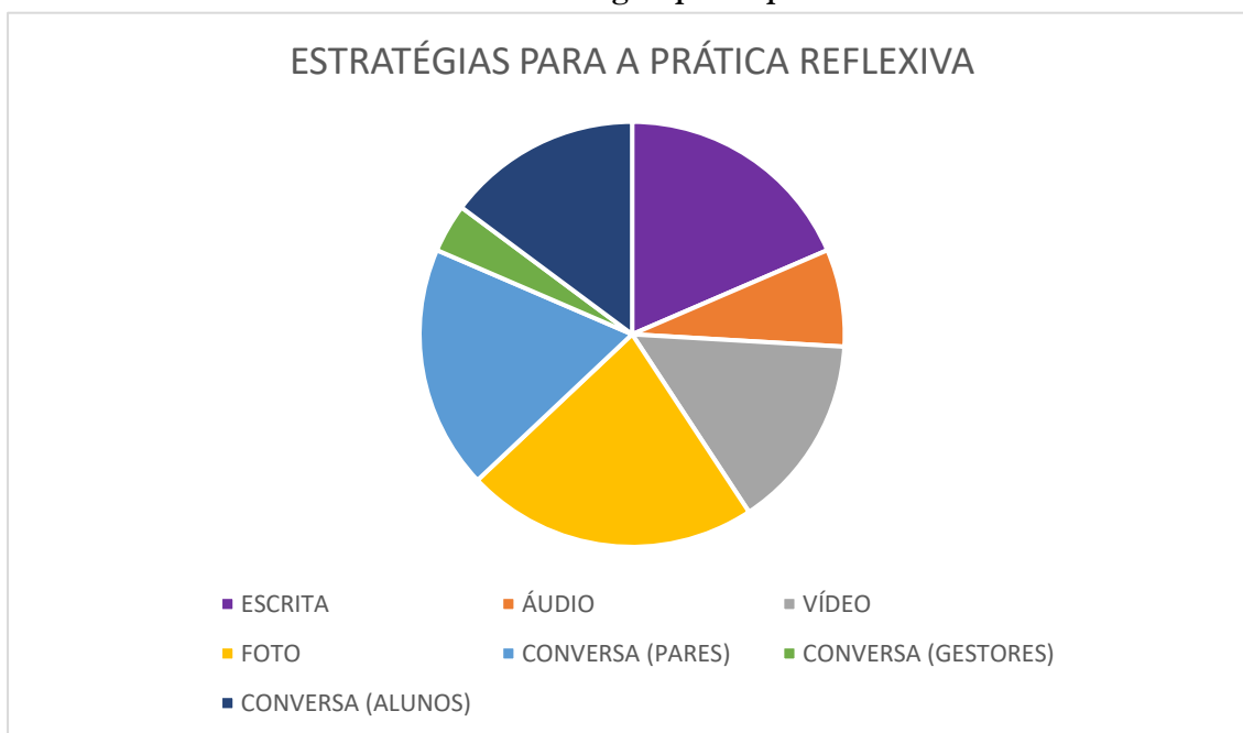
Gráfico 2: Estratégias para a prática reflexiva

do desenvolvimento profissional, já que a docência não acontece de forma solitária e nem se limita apenas a acontecimentos internos, mas se faz no diálogo, na troca com o outro.