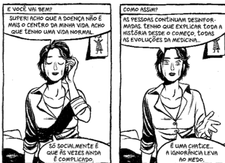
Figura 5: Mensagem final de Cati pedindo que as pessoas descubram mais sobre o HIV.

Como mensagem final de Pílulas Azuis temos um recado de Cati sobre o desconhecimento e como ele gera dificuldades na vida de pessoas soropositivas no presente e reforça uma (pre)concepção que prejudica populações futuras (Figura 5). O conhecimento, em especial, construído através de práticas de educação sexual sob viés crítico, é uma potente ferramenta para acabar com o preconceito e os estigmas.