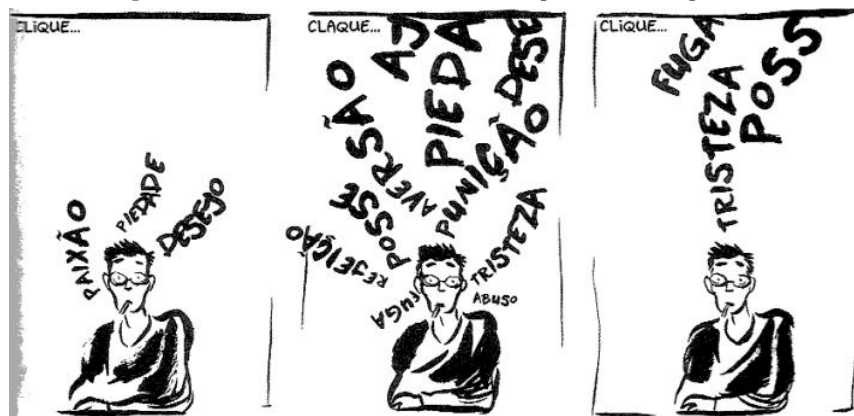
Figura 3: Reação de Peeters ao descobrir que Cati é soropositiva.