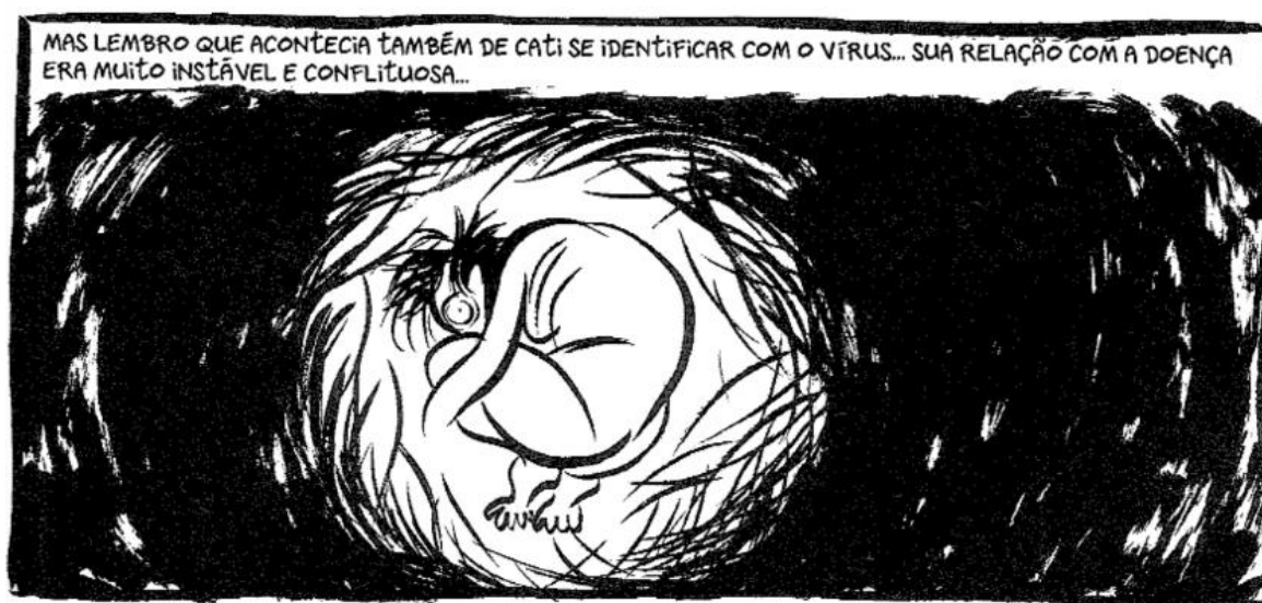
Figura 11: Peeters reflete como a infecção afeta aspectos emocionais de Cati.

Além deste ponto, observamos como os sentimentos de culpa são constantes na vida de Cati. Peeters informa ao leitor durante a narrativa que esses sentimentos são despertados não por Cati ter se infectado, mas por seus desdobramentos, como infecção do filho e a possibilidade de transmitir o vírus para Peeters. Aumentando o peso emocional carregado por esses sujeitos. O autor-personagem também destaca a importância de momentos de respiro para “esquecer” a infecção e as dificuldades do tratamento (Figura 11). Dessa forma, Peeters reforça a importância do cuidado com a saúde mental de sujeitos afetados pelo HIV.