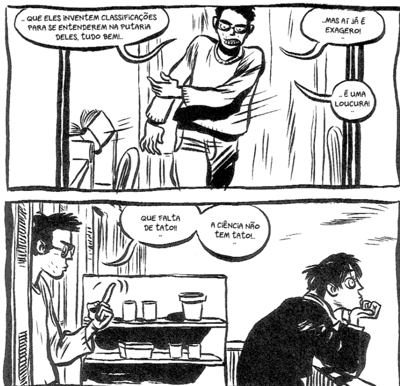
Figura 12: Descontentamento de Peeters sobre o fazer científico.

A imagem que as pessoas fazem do(a) cientista pode nos fornecer dados importantes para entender como se relacionam com a ciência. A visão caricata de cientistas pode ser um dos motivos pelos quais as pessoas não se interessam pela ciência e, também, pode estar entre as causas de graves distorções da atividade científica. É preocupante a quantidade de pessoas que acreditam que o conhecimento científico torna pessoas perigosas. Destarte, a importância em se utilizar formas de entender a ciência e sua configuração de desenvolvimento, o que pode ser favorecido pelo uso de materiais de divulgação da ciência. Nesse contexto, a ciência pode ser problematizada de modo a entender o seu papel na sociedade, minimizando concepções contraditórias acerca “do bem e do mal” produzido por ela, bem como, que tal conhecimento tem de ser estudado, compreendido e acessível para todos Delabio et al. (2021, p. 288).