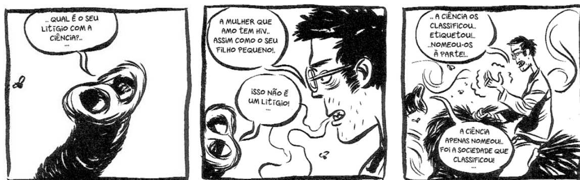
Figura 1: Diálogo entre Frederik Peeters e um mamute presente no romance gráfico Pílulas Azuis.

Palabras clave: Aids, enseñanza de las ciencias, artes secuenciales, educación para la salud.