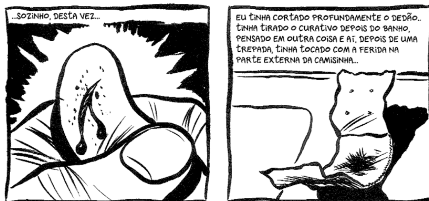
Figura 8: Peeters se desespera após sua camisinha entrar em contato com uma ferida no dedo.