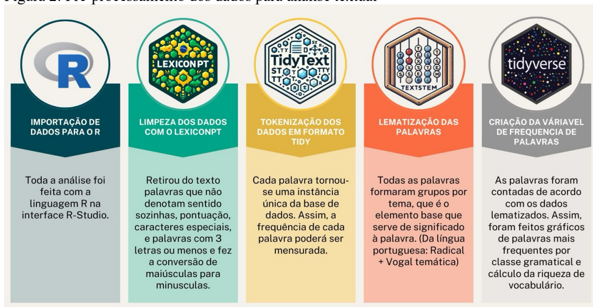
Figura 2: Pré-processamento dos dados para análise textual

Por fim, foram gerados 14 documentos na extensão .txt, sendo estas as fontes de dados para análise. Os dados foram preparados para análise seguindo 5 etapas de pré-processamento, conforme ilustra a Figura 2.