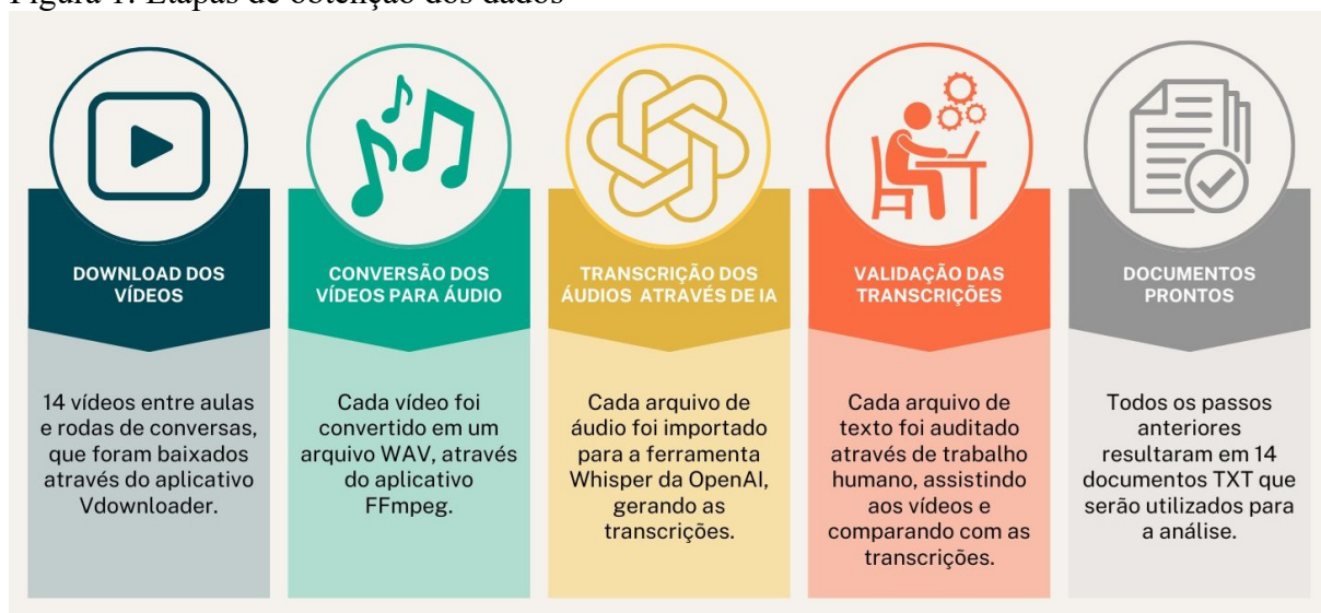
Figura 1: Etapas de obtenção dos dados

A natureza dos dados é textual, remetendo a uma abordagem qualitativa. Contemplam os dados duas fontes: A transcrição de sete videoaulas do curso de capacitação e a transcrição de seis rodas de conversa com as mulheres participantes. A dinâmica do curso de capacitação se deu com a disponibilização de uma videoaula seguida de uma roda de conversa. Uma aula extra acabou emergindo a partir de ensinamentos das participantes e das formadoras do curso. O processo de obtenção dos dados é descrito a seguir em cinco etapas, conforme a Figura 1.