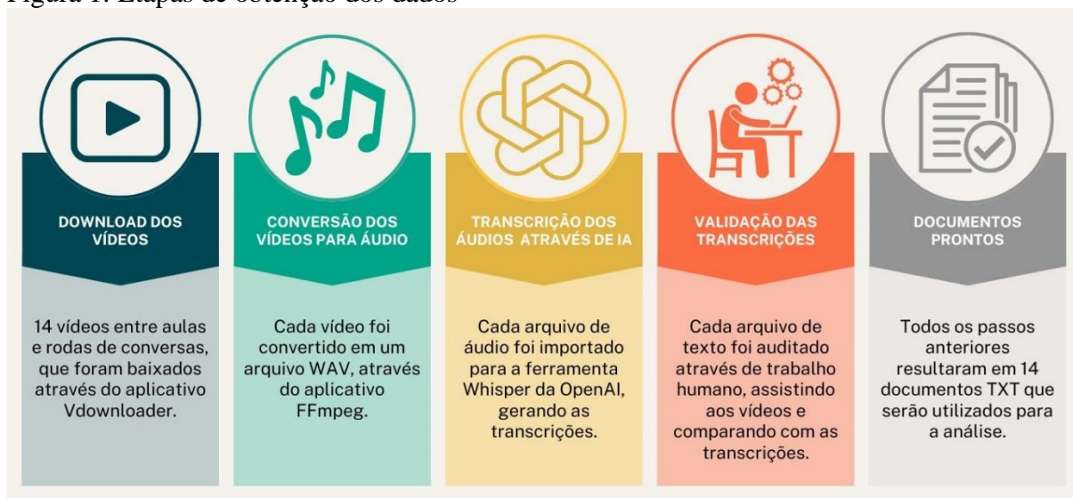
Figura 1: Etapas de obtenção dos dados

A natureza dos dados é textual, remetendo a uma abordagem qualitativa. Contemplam os dados duas fontes: A transcrição de sete videoaulas do curso de capacitação e a transcrição de seis rodas de conversa com as mulheres participantes. A dinâmica do curso de capacitação se deu com a disponibilização de uma videoaula seguida de uma roda de conversa. Uma aula extra acabou emergindo a partir de ensinamentos das participantes e das formadoras do curso. O processo de obtenção dos dados é descrito a seguir em cinco etapas, conforme a Figura 1.