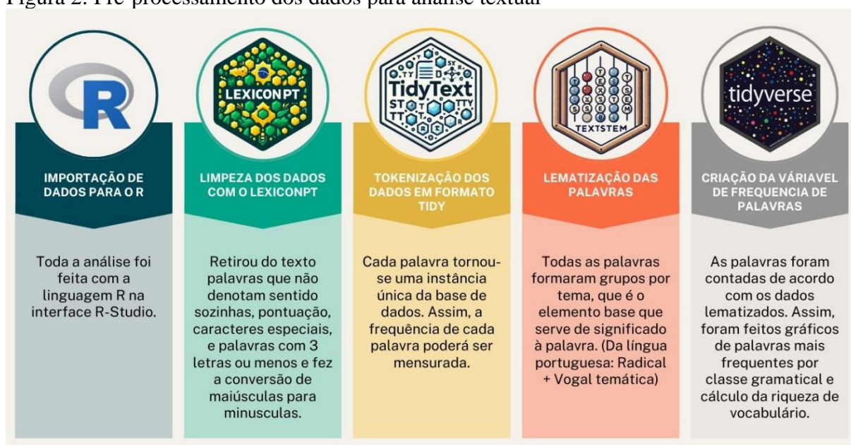
Figura 2: Pré-processamento dos dados para análise textual

Por fim, foram gerados 14 documentos na extensão .txt, sendo estas as fontes de dados para análise. Os dados foram preparados para análise seguindo 5 etapas de pré-processamento, conforme ilustra a Figura 2.