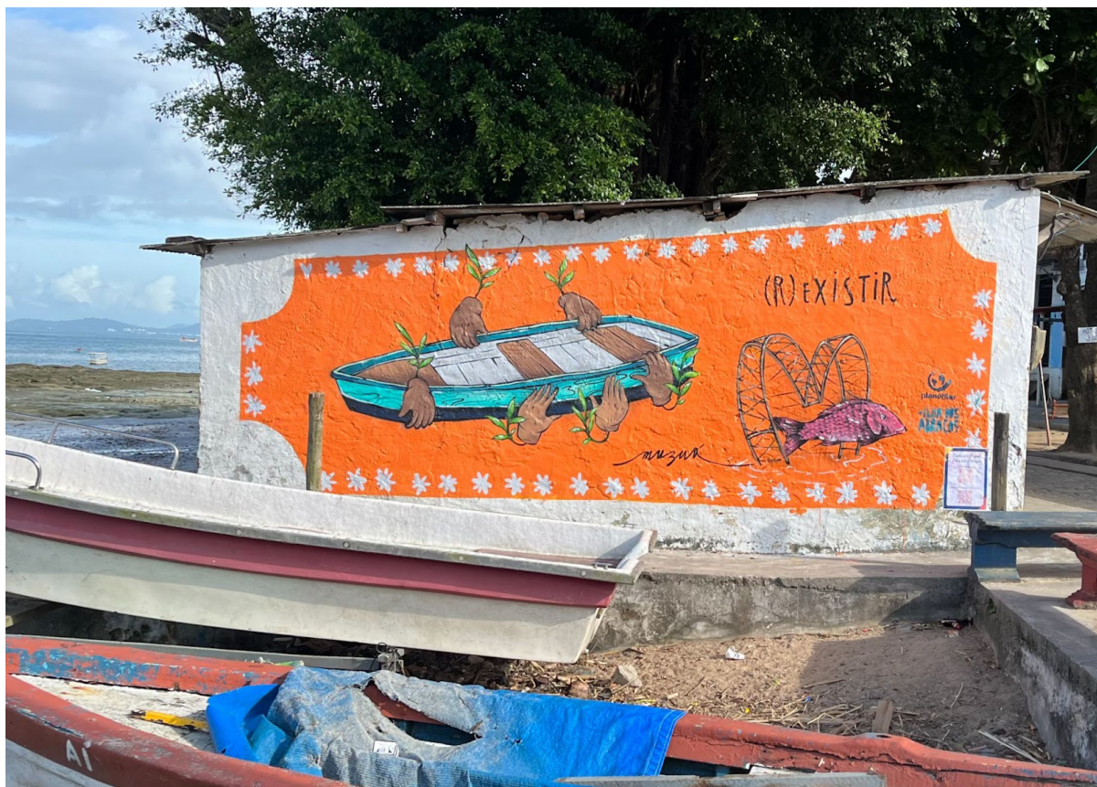
Figura 2. (R)EXISTIR. Comunidade de Santana - Ilha de Maré, em Salvador-BA.

Nos dias 13-14/11/2022 pintou-se em Bananeiras, no Mercado do Bico, o painel de grafite retratando a refinaria e o porto como um monstro, e acompanhado da frase “Poluição do (m)ar mata. Até quando?”. O painel é acompanhado de duas crianças negras soprando este monstro. Uma delas com o símbolo do Movimento dos Pescadores e Pescadoras Artesanais do Brasil (MPP) 14 em sua camiseta, evidenciando a luta da comunidade (fig. 3).