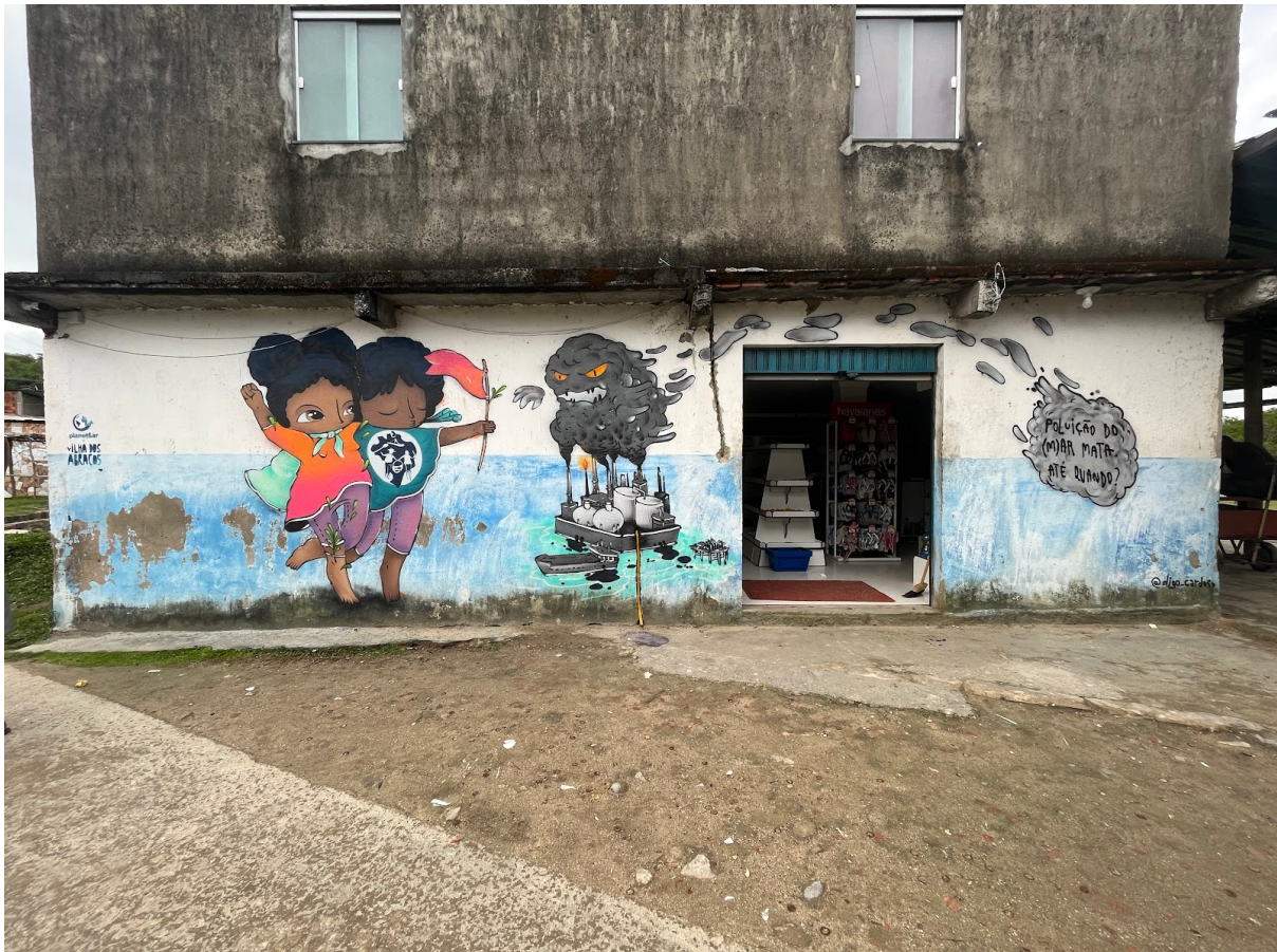
Figura 3. Poluição do (m)ar mata. Até quando?. Comunidade de Bananeiras - Ilha de Maré, em Salvador-BA.

Neste dia seguiram-se as entrevistas para a construção do mapa de memórias da Ilha de Maré. A própria comunidade indicava as próximas pessoas para compor o mapa. Simultaneamente aconteceu a “máquina de retratos” onde o quadrinista desenhava uma caricatura da pessoa olhando através de um retângulo recortado em uma caixa. Após os primeiros desenhos as crianças ocuparam a “máquina de retratos” (fig. 4) - utilizada diversas vezes nas ações -, desenhando retratos umas das outras.