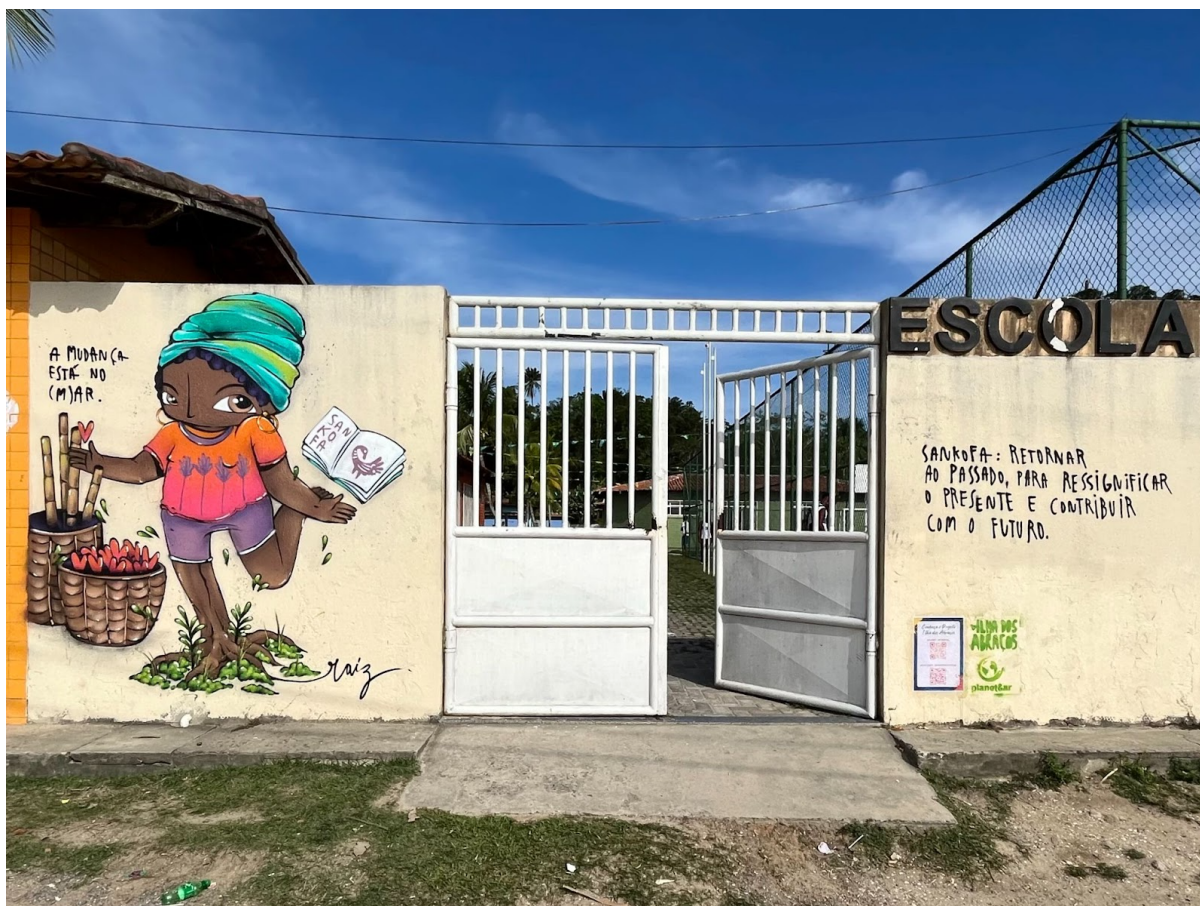
Figura 7. “A mudança está no (m)ar”. Além das palavras “Sankofa: Retornar ao passado para ressignificar o presente e contribuir com o futuro”. Comunidade de Praia Grande - Ilha de Maré, em Salvador-BA.

A frase “a mudança está no (m)ar” faz um jogo de palavras sobre “mudanças climáticas” e a possibilidade dos estudantes mudarem, interligando-se com o trabalho da escola signatária do Movimento Escolas pelo Clima 12 , que reflete sobre as mudanças climáticas. No painel, uma mulher tem o pé como parte do mangue, revisitando a ideia de ancestralidade, rizoma e raiz (fig. 7). Aparecem elementos culturais da comunidade, como o artesanato feito da cana brava.