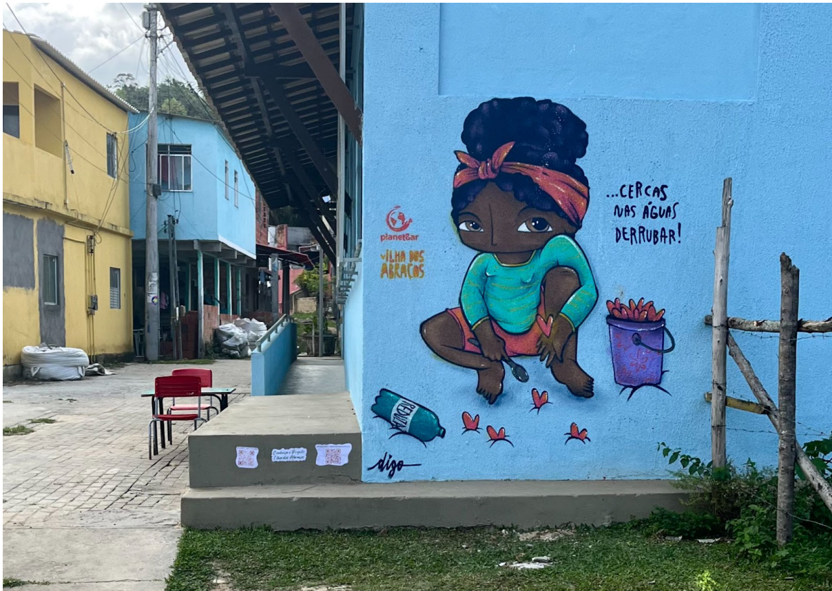
Figura 6. “Cercas nas águas derrubar!”. Comunidade de Botelho - Ilha de Maré, em Salvador-BA.