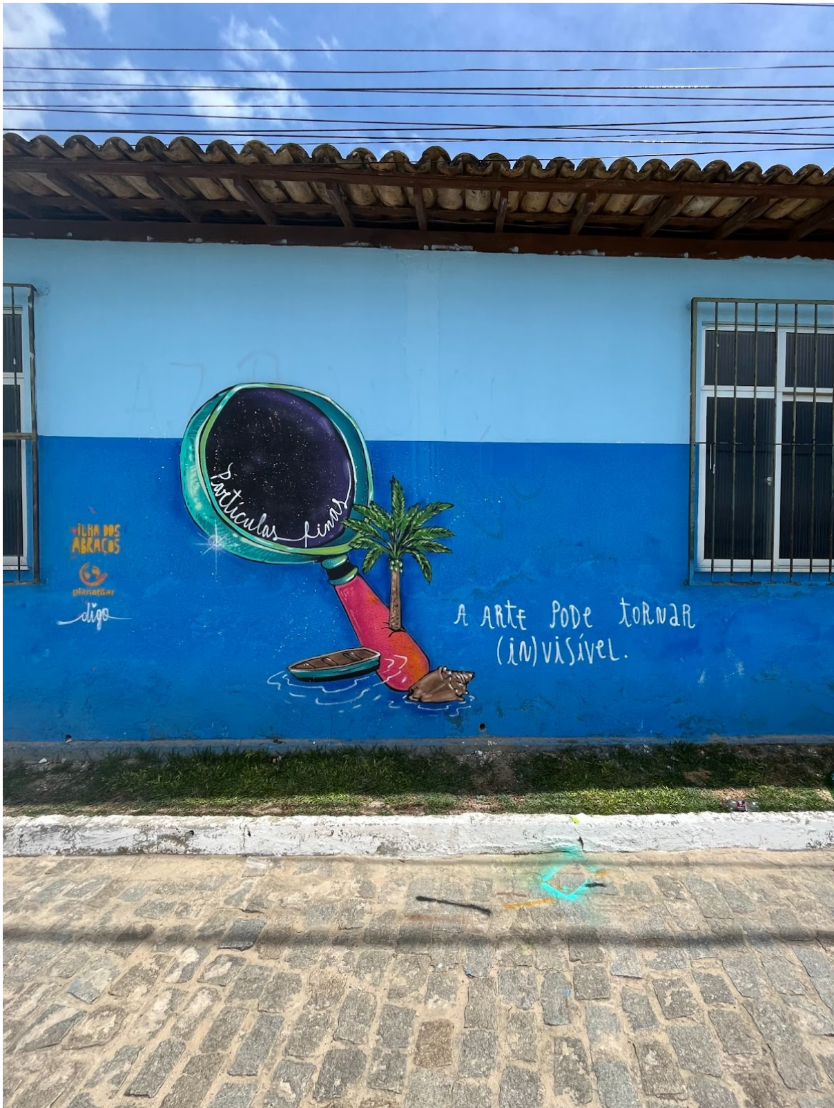
Figura 8. “Partículas finas” e “a arte pode tornar invisível”. Comunidade de Praia Grande - Ilha de Maré, em Salvador-BA.

No dia 18/11/2022 aconteceram entrevistas para o mapa em Itamoabo. No dia 19/11/2022 a comunidade e o projeto celebraram a conclusão das atividades visitando a Praia