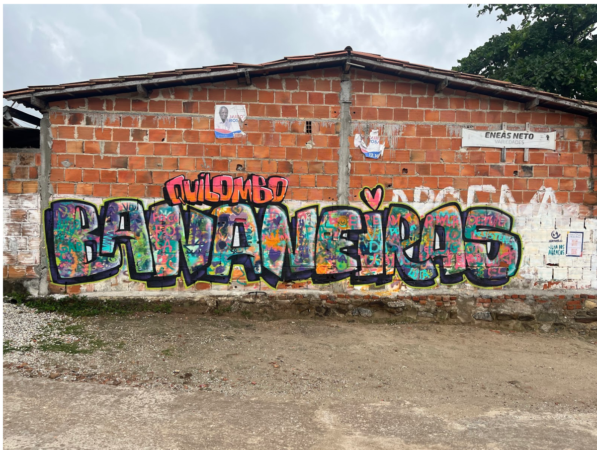
Figura 5. Quilombo Bananeiras. Comunidade de Bananeiras - Ilha de Maré, em Salvador-BA.

Em 15/11/2022 foram realizados dois grafites e a atividade da máquina de retratos na escola municipal de Botelho. O primeiro grafite planejado com a comunidade retratava uma mulher negra mariscando corações e um detalhe de uma garrafa plástica escrito “reduza”. A frase escolhida foi a estrofe final do “grito de guerra” do MPP 15 (p. 1): “No rio e no mar: Pescadores da Luta! / Nos açudes e barragens: Pescando liberdade! / Hidronegócio: Resistir! / Cercas nas águas: Derrubar!” (fig. 6).