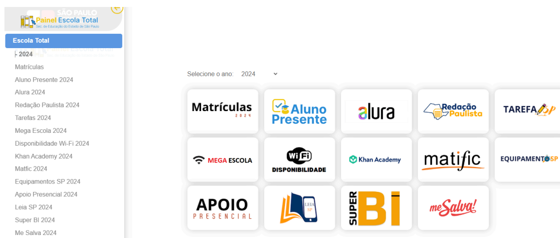
Figura 5 - Acesso inicial da Plataforma B.I. Educação / Escola Total