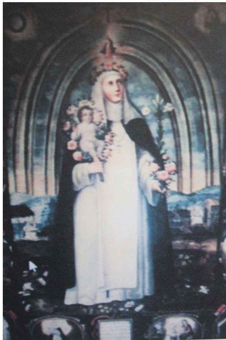
Figura 1: Santa Rosa de Lima, Juan Correa, siglo XVII