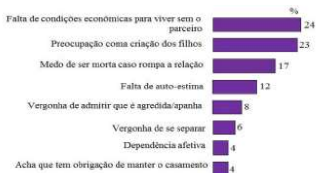
Figura 2 - Razões que levam a mulher a continuar com o agressor