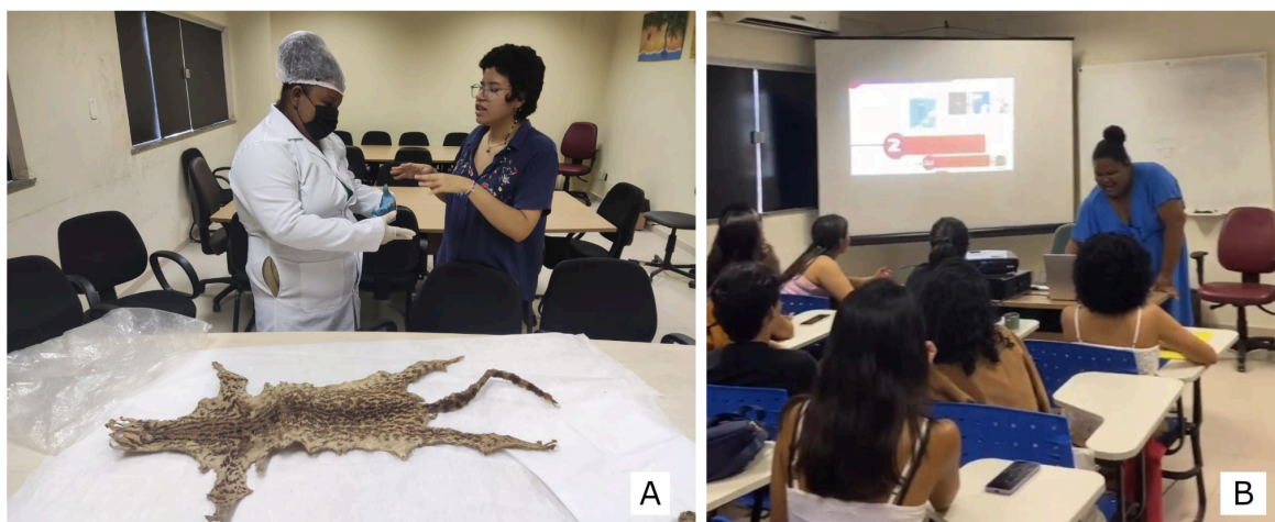
Figura 1 - Monitoria durante o primeiro semestre de 2023 A. Interação da monitora com discentes em horário reservado para tirar dúvidas B. Apresentação da monitora para a turma.

A ABP concretizou nesse contexto ao proporcionar uma experiência prática e direta na elaboração de políticas de documentação, essencial para a formação dos futuros museólogos. A inclusão de uma monitora (figura 1) na turma melhorou significativamente a comunicação entre docentes e discentes, facilitando a identificação e o endereçamento das principais dificuldades.