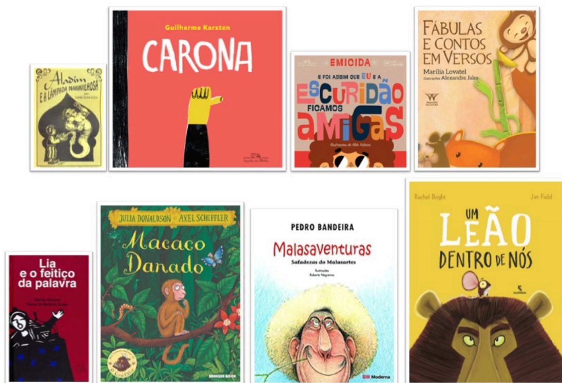
Figura 3 – Capas dos livros que compõem o grupo de poesias narrativas

Apesar das diferenças entre os textos, há similaridades entre os conjuntos, tais como a presença do humor, personagens animais, personagens monstruosos, protagonista preto, protagonista feminina, protagonista masculino, presença de auxiliar mágico.