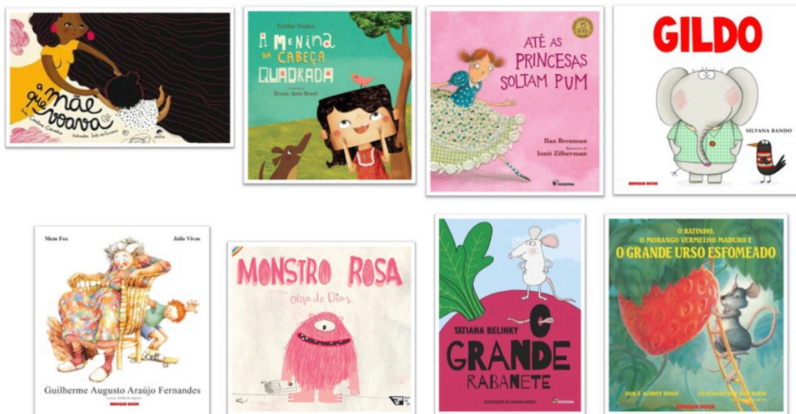
Figura 1 – Capas dos livros que compõem o grupo de narrativas simples 7