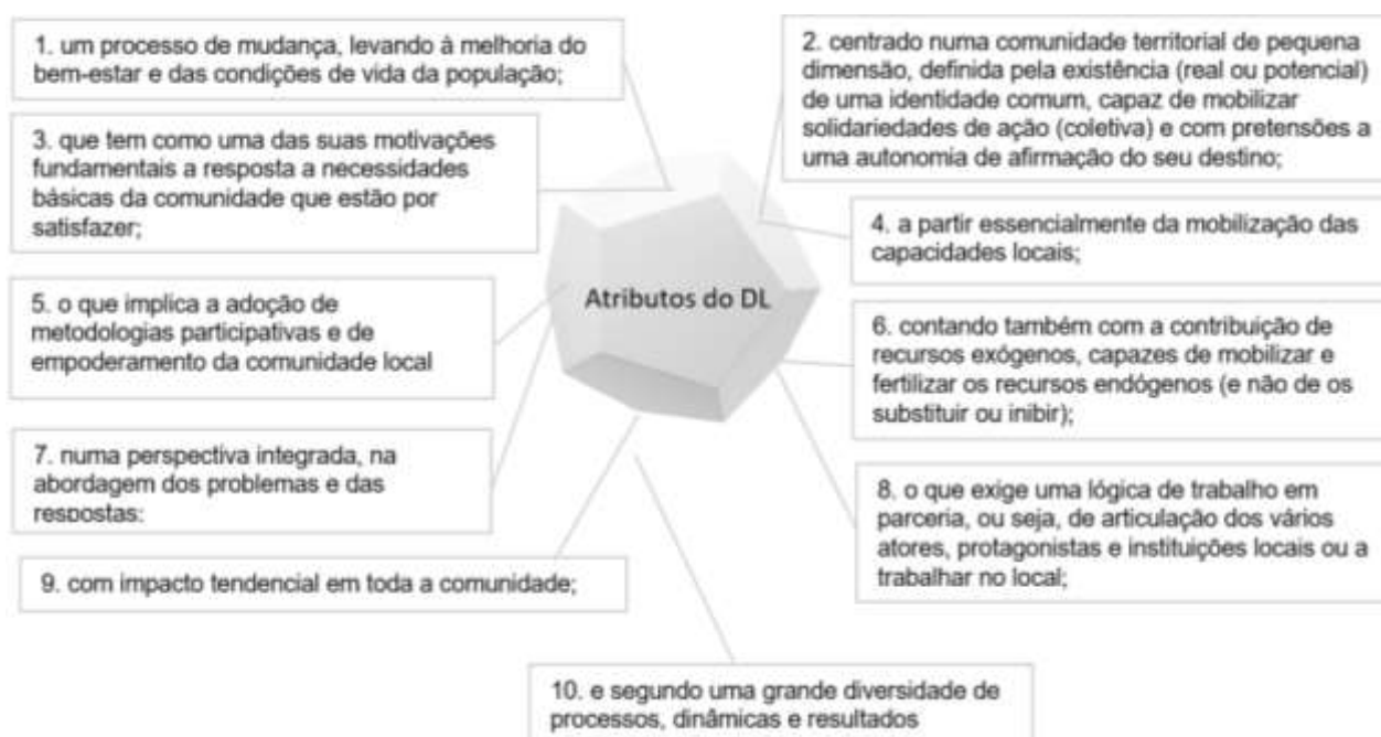
Figura 4: Atributos no processo para Desenvolvimento Local (Amaro, 2009)

Ainda segundo Amaro, em processo de Desenvolvimento Local, devem existir os seguintes 10 atributos: