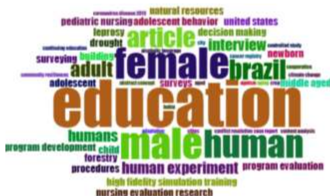
Figura 2: Nuvem de palavras

Dentre as palavras mais usadas dentro dos artigos se destacam educação, mulher, homem, humano, artigo, Brasil, adulto, experiência humana, entrevista. Como programa Bibliometrix foi possível criar a nuvem de palavras da representada na Figura 2.