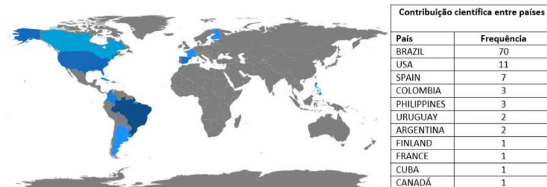
Figura 1: Os diferentes cenários dentro das publicações