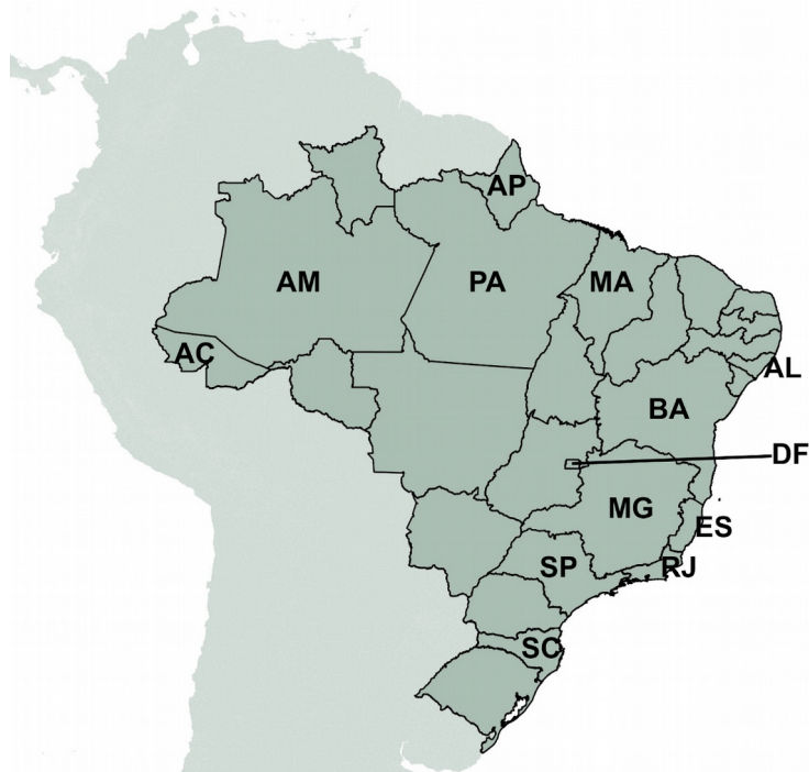
Figura 1. Distribuição dos genomas analisados por unidade federativa. Siglas: AC=Acre (n=1), AL=Alagoas (n=1), AM=Amazonas (n=1), AP=Amapá (n=6), BA=Bahia (n=2), DF=Distrito Federal (n=7), ES= Espírito Santo (n=1), MA=Maranhão (n=1), MG=Minas Gerais (n=13), PA=Pará (n=6), RJ=Rio de Janeiro (n=70), SC=Santa Catarina (n=2), SP=São Paulo (n=13). Origem desconhecida (n=1).