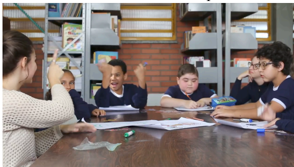
Figura 2. Oficina de desenhos realizada na EMEF para Surdos Vitória (Canoas/RS)

Nesta seção, será analisado um recorte de cena argumentativa proveniente das oficinas de humor realizadas na EMEF para Surdos Vitória (município de Canoas/RS), mais especificamente na Oficina de Desenhos (Figura 2). Na ocasião, a turma, juntamente à pesquisadora e à professora da classe, está sentada em volta de um conjunto de mesas. As crianças estão fazendo desenhos e conversando. Durante a conversa, os alunos começam a observar o anel na mão da pesquisadora.