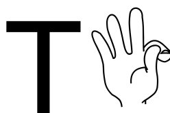
Figura 6. Configuração de mãos da letra “T” no alfabeto manual da Libras