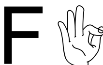
Figura 5. Configuração de mãos da letra “F” no alfabeto manual da Libras

não quer contribuições do colega. Os encadeamentos enunciativos-discursivos seguem-se enquanto há oposições entre os enunciados dos dois alunos. O fluxo é interrompido quando os professores concedem informações sobre os traços distintivos da configuração de mãos (unidade fonológica) de F e T em Libras, conforme é possível visualizar nas Figuras 2 e 3. Evidencia-se, aqui, o papel e importância da intervenção do professor nos discursos argumentativos em sala de aula. Nesse sentido, para Leitão (2011, p 37) “o objetivo claro do professor em todas essas atividades é, sobretudo, encorajar a criança à formulação de pontos de vista, à escuta e consideração da opinião de outros e à subsequente reação a ela (acordo, desacordo)”.