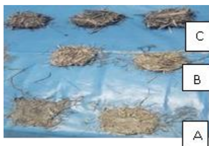
Figura 7. A. Discos inoculados con Aspergillus sp. B y C Discos control

Tras la aplicación de discos de matriz sólida inoculados con Aspergillus sp se evidencio el crecimiento micelial en la matriz de biomasa a los 30 días. Asimismo, se logró la degradación de la biomasa a diferencia de los discos control que se mantienen en el volumen y características iniciales