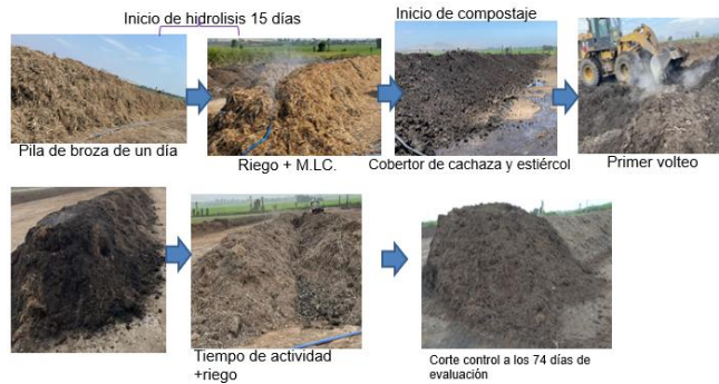
Figura 4: Proceso de incorporación mediante regado de los microorganismos lignocelulolíticos.

La materia orgánica se mantuvo por encima de 70% por lo que está disponible para su interacción con el suelo y cultivo. La lignina tiene una tendencia a bajar en todo el proceso, y los resultados de azúcares reductores cuanto más elevados, indican se relaciona con el proceso de degradación o rotura de enlaces de carbonos que se relaciona con la lignina, celulosa y hemicelulosa. Se evidencia la gran presencia de materia orgánica pues se mantiene por encima de 70% por lo que indica que está disponible para su interacción con el suelo y cultivo. Por otro lado, la lignina tuvo una tendencia a la baja de aproximadamente 40% a 20% en todo el proceso, y los resultados de azúcares reductores estuvieron fluctuando al alza, pues cuanto más elevados indican que se está desarrollando el proceso de degradación o rotura de enlaces de carbonos de la lignina, celulosa y hemicelulosa. De esta manera podemos determinar que se ha logrado la degradación de la lignina generando un abono enriquecido.