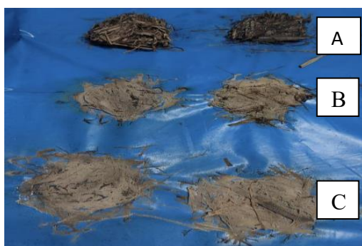
Figura 2. A. Discos control. B y C discos inoculados con Pleurotus ostreatus .

Tras la aplicación de discos de matriz sólida inoculados con Pleurotus ostreatus se evidenció el crecimiento micelial en la matriz de biomasa a los 30 días. Asimismo, se logró la degradación de la biomasa a diferencia de los discos control que se mantienen en el volumen y características iniciales.