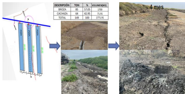
Figura 6. Pozas de degradación.