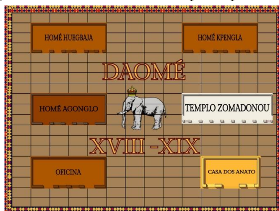
Imagem 4: Tabuleiro desenvolvido para a prática do jogo

No tabuleiro, os lugares foram dispostos aleatoriamente com o desenho de uma planta baixa da área, marcando suas entradas por meio de um espaço vazio para que os jogadores facilmente identifiquem. A opção por essa distribuição é por não ser possível um remanejamento fiel do lugar, já que essas arquiteturas ficavam em lugares distintos, mas para manter a ludicidade do jogo, foi mantido a atual distribuição. Com exceção dos lugares descritos o restante do tabuleiro é quadriculado para locomoção dos jogadores, que por meio do dado é definido o número de casas a avançar como evidenciado abaixo: