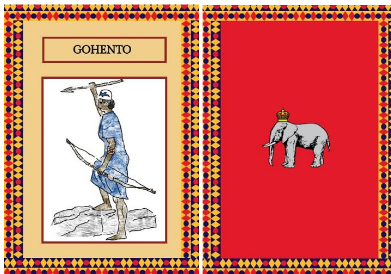
Imagem 1: Carta da guerreira Gohento referente aos suspeitos