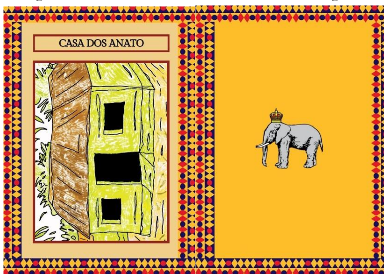
Imagem 3: Carta da Casa dos Anato referente aos lugares