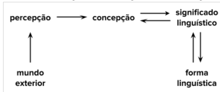
Figura 2 - Níveis de representação no processo de conceptualização