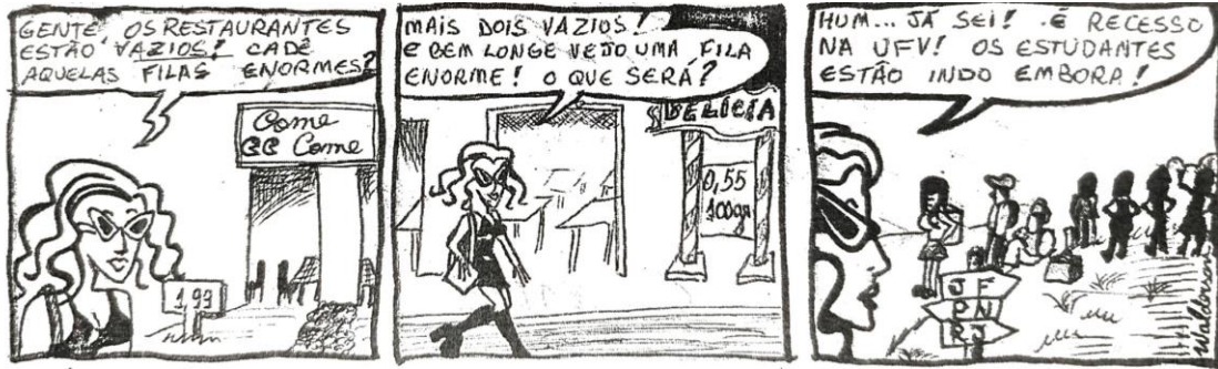
Figura 3 – Tirinha sobre as mudanças na cidade durante o período de recesso.

que, apesar de ter periodicidade mensal, havia meses em que a publicação do número não era possível em virtude da falta de anunciantes.