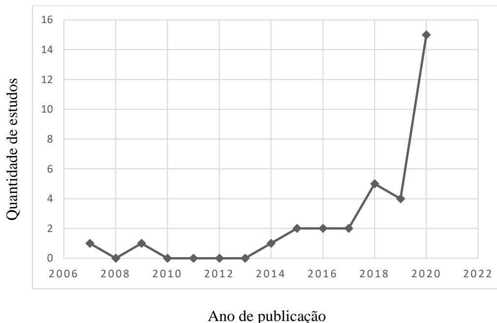
Figura 2: Distribuição dos estudos em relação aos anos de publicação