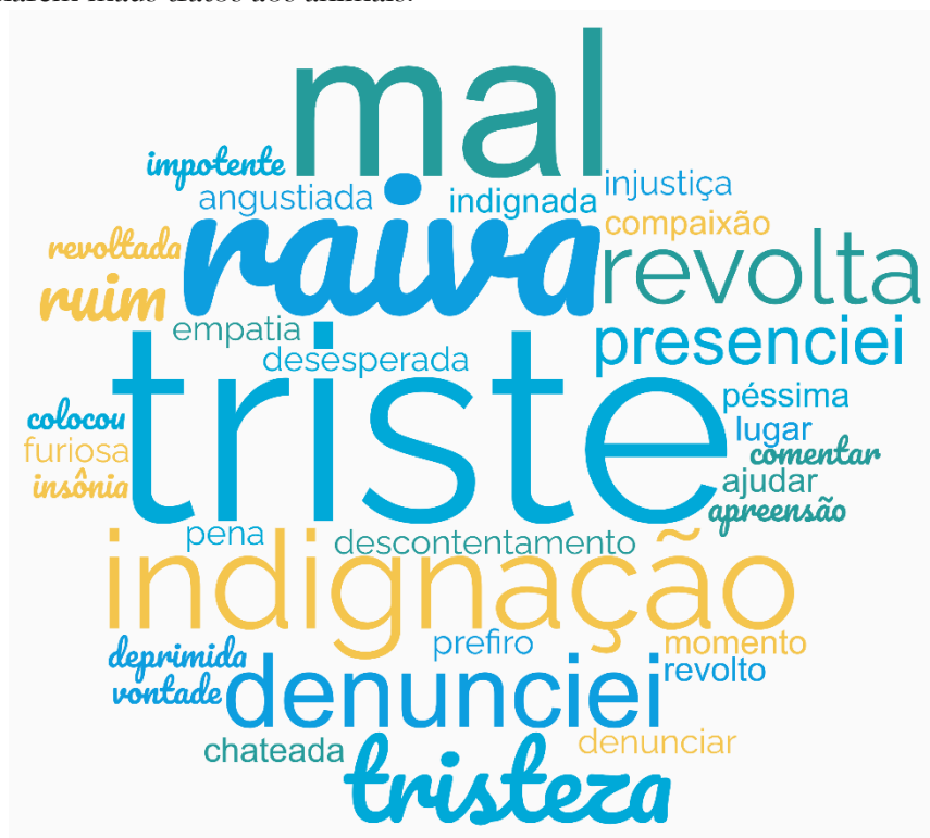
Figura 3 - Sentimentos descritos pelos profissionais da Educação Infantil de Boa Vista RR, 2023, ao presenciarem maus tratos aos animais.

Nos relatos voluntários dos participantes, a figura masculina está presente na maioria. Segundo Ascione e Shapiro (2009) é o gênero mais envolvido em violência a animais e outros vulneráveis, já Casimiro (2022) considera que o perfil do agressor de animais de companhia também pode variar em termos de gênero (feminino ou masculino). É importante frisar que todos os indivíduos, homens e mulheres estão envoltos nessa sociedade culturalmente machista e patriarcal, nesse sentido o agressor é um sujeito construído socialmente que acaba reproduzindo nas suas relações sociais os traços machistas impostos ao longo do seu desenvolvimento (LÓBO; LÓBO, 2015), sendo capaz de subjugar seres mais vulneráveis, e esses comportamentos agressivos, são frequentemente expressos em contextos privados, de modo a evitar o julgamento dos outros, e possíveis intervenções legais (BRADSHAW, 2017). As taxas de maus-tratos a animais são mais elevadas em grupos onde crianças são maltratadas, e em famílias que sofrem violência de parceiros íntimos. O que indica uma "ligação" entre as formas de violência, a Teoria do Elo (ASCIONE; SHAPIRO, 2009).