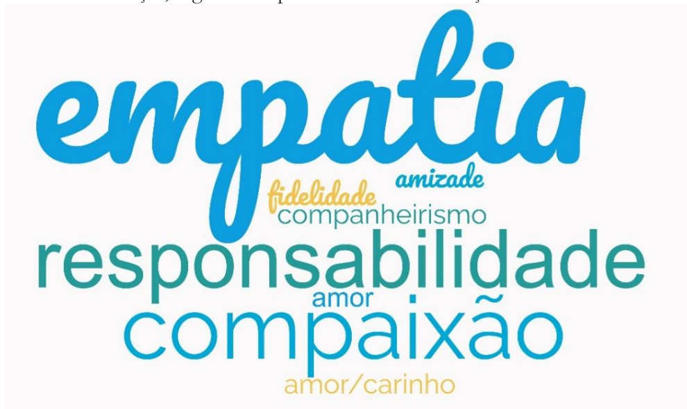
Figura 4 – Palavras chaves sobre a percepção quanto aos sentimentos que o contato com animais pode desenvolver nas crianças, segundo os profissionais de Educação Infantil de Boa Vista-RR, 2023.

considerados centrais para a vida familiar (DOWNEY; ELLIS, 2008; WINTERMANTEL; GROVE, 2022), inspiram oportunidades para aprender, para brincar e para serem "pais" desenvolvendo responsabilidades (HOLBROOK et al., 2001).