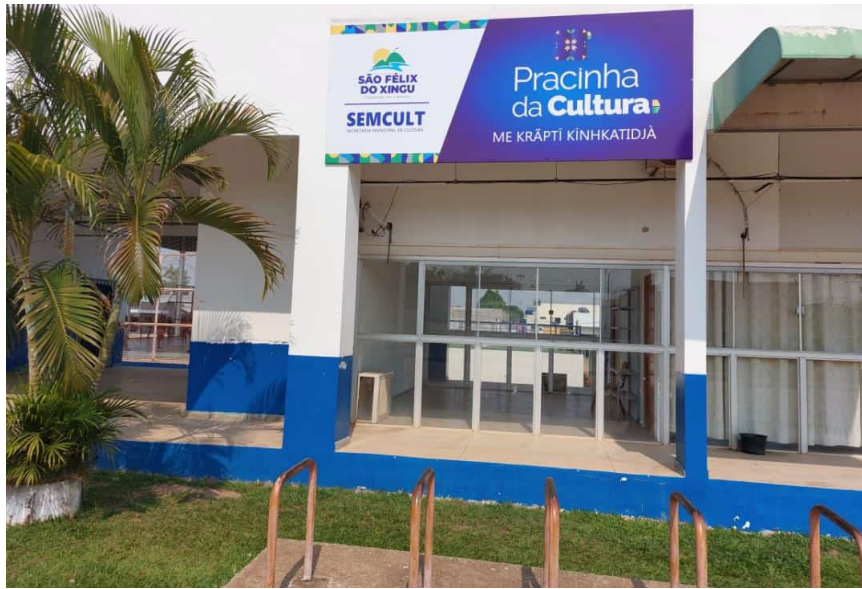
Figura 9: Pracinha da Cultura - Me krāptī kīnhkatidjā.