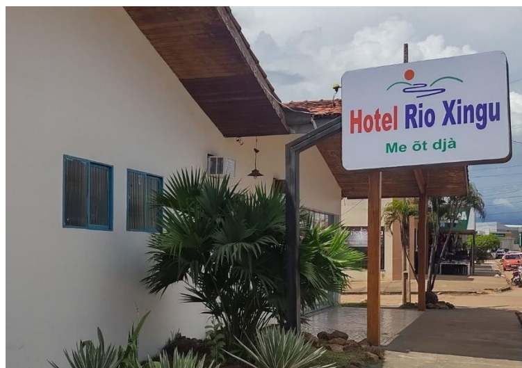
Figura 7. Hotel Rio Xingu – Me ôt djà .

A Lei Municipal n. 571/2019, no art. 5, determina que “as pessoas jurídicas estabelecidas no município de São Félix do Xingu deverão adotar atendimento e mensagens ao público no idioma oficial e naquele cooficializado por esta Lei”. Dessa forma, um hotel na cidade foi o primeiro estabelecimento privado a adotar esta medida, ao incluir em sua sinalização o termo em Mebêngôkre para hotel, na língua: Me ôt djà (Me-humano/gente; ôt – dormir; djà – função/lugar).