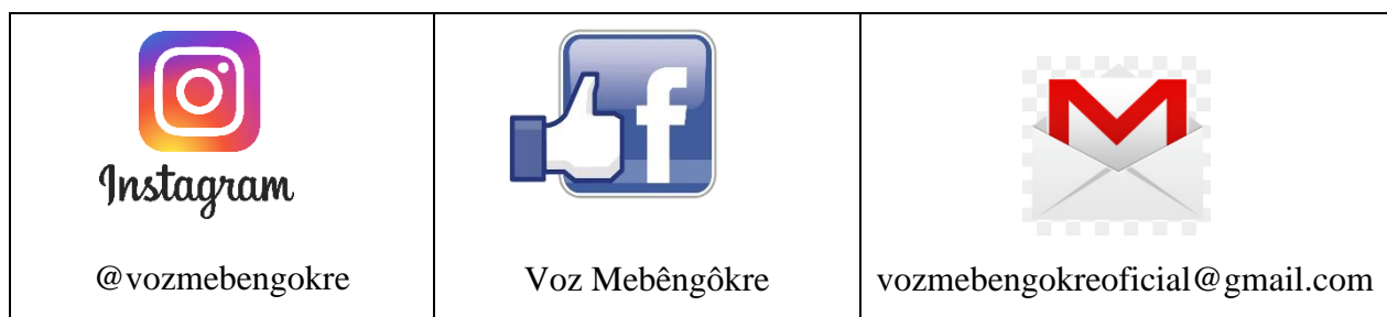
Figura 5: Nossas redes.

A metodologia da Ação Me kunĩ umari — A Voz Mebêngôkre — é entrevistar falantes de Mebêngôkre, presencialmente, com gravação em áudio e/ou vídeo, sobretudo professores indígenas, que portam as questões de sua comunidade sobre as reivindicações de direitos linguísticos e inserção de sua cultura na educação oficial. Foi montado um grupo de WhatsApp, com participantes de diversas aldeias, para formar uma rede de comunicação, a fim de agilizar tomadas de decisão sobre problemas coletivos. Os depoimentos, reivindicações e posicionamentos dos indígenas são repostados nas redes, para ganharem visibilidade.