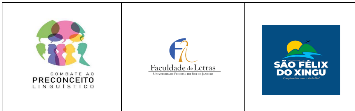
Figura 3: Logos dos parceiros no projeto de extensão.