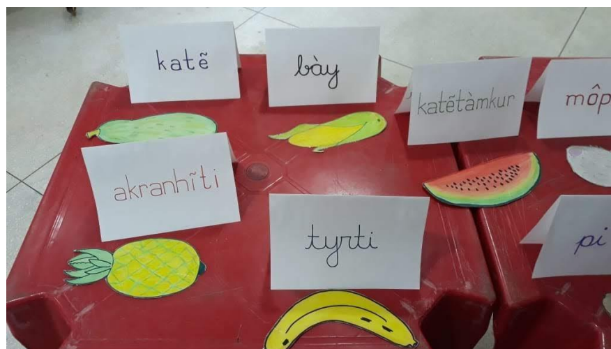
Figura 1: Nomes em Mebêngôkre para alimentos cultivados na roça. Curso Instrumental de Kayapó.