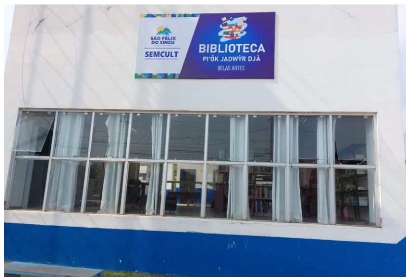
Figura 8: Biblioteca Belas Artes - Pi'ók jadjwỳr djà.