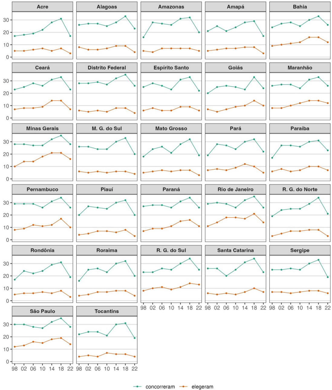
Figura 2: Número de partidos que concorreram e elegeram deputados federais (unidades que elegem até 12 deputados), 1998-2022.