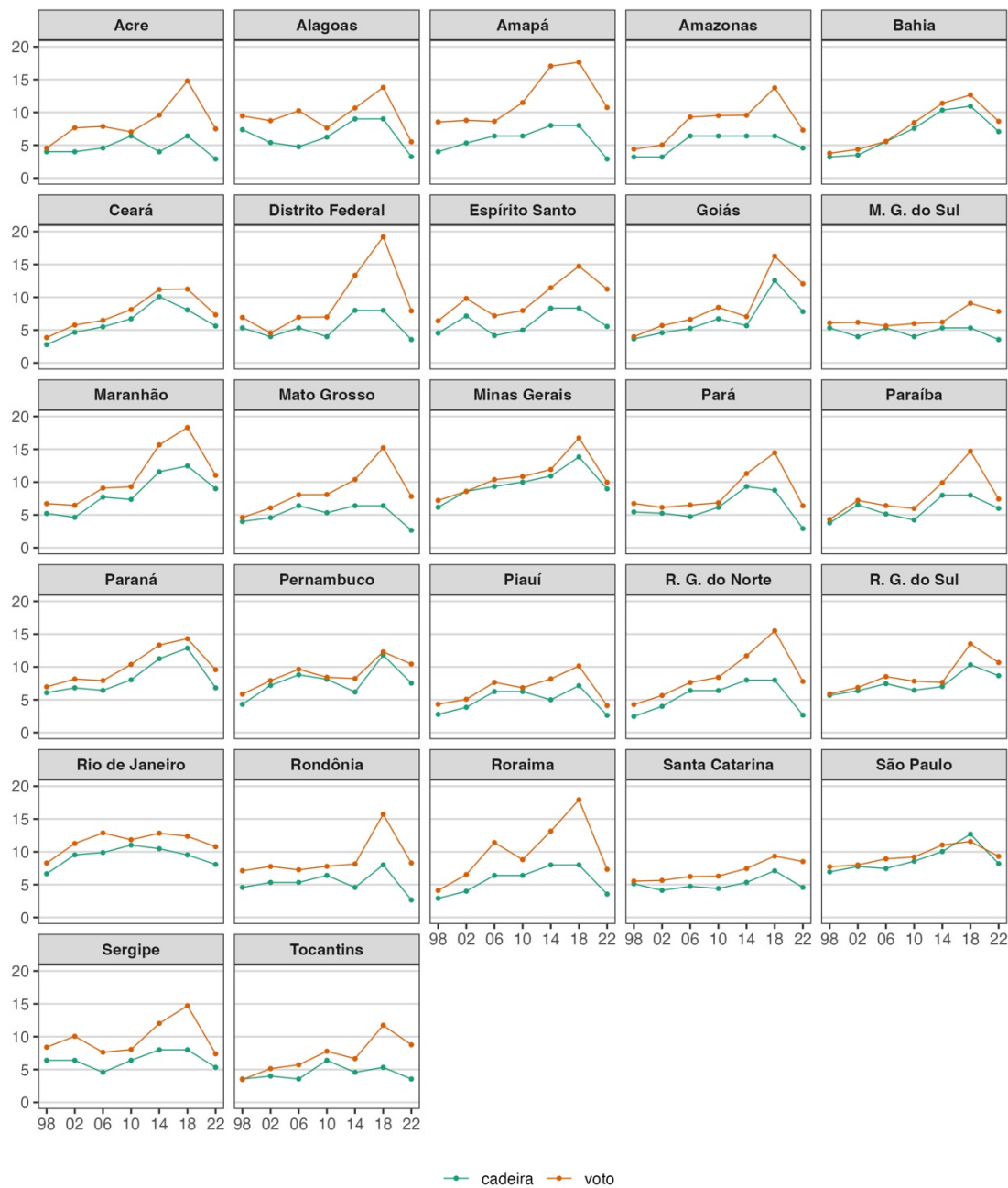
Figura 3: Número efetivo de partido (NEP) por unidade da federação. Votos e cadeiras. Câmara do Deputados (1998-2022).