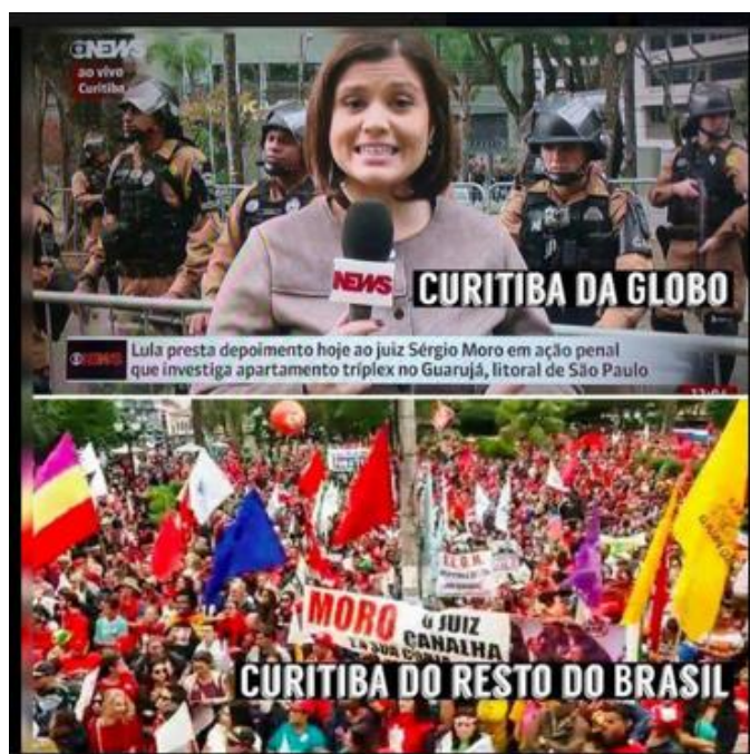
Figura 2: Sobre cobertura da Globo News em Curitiba.

No exemplo seguinte (Figura 2) a Mídia Ninja fala da cobertura da Globo News sobre depoimento do ex-presidente Lula ao juiz Sergio Moro, em Curitiba. É exibida uma imagem de repórter da Globo News tendo ao fundo soldados e, em contraposição, uma imagem com populares empunhando bandeiras. As legendas “Curitiba da Globo ” e “Curitiba do resto do Brasil” completam a publicação, apontando manipulação na cobertura da mídia mainstream . Esse tipo de publicação da Mídia Ninja ajuda a questionar a defendida neutralidade da mídia convencional.