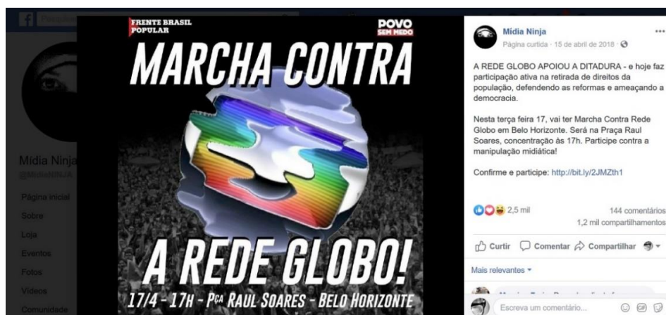
Figura 3: Divulgação de marcha contra a Rede Globo .

A Mídia Ninja estimula abertamente a percepção da Rede Globo como “inimiga”, como na publicação a seguir (Figura 3), em que divulga uma marcha contra a Rede Globo , em Belo Horizonte, e afirma: “A Rede Globo apoiou a ditadura”.