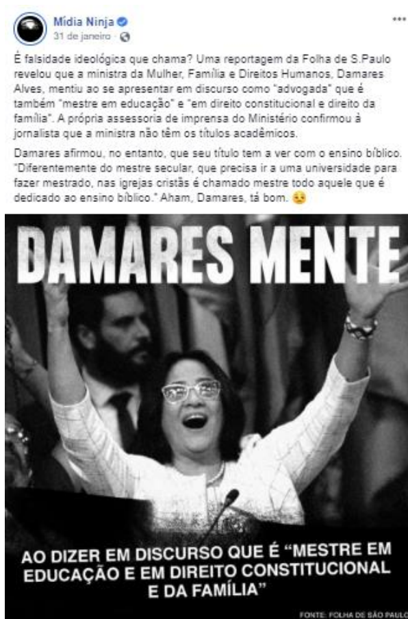
Figura 8: Sobre falsa formação acadêmica da Ministra Damares.