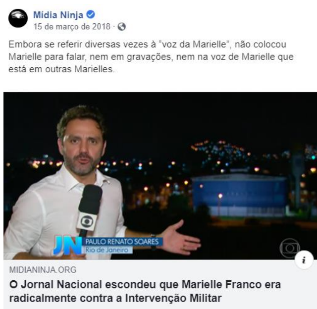
Figura 4: Sobre cobertura do Jornal Nacional, TV Globo .

Quando Marielle Franco, vereadora do Rio de Janeiro (PSOL), foi assassinada, a Mídia Ninja elencou as “falhas” do Jornal Nacional (Rede Globo) : o telejornal não colocou imagens de Marielle falando, não entrevistou mulheres de movimentos sociais próximas de Marielle e não disse que a vereadora era contra a intervenção militar no Rio de Janeiro (Figura 4).