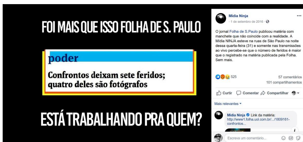
Figura 1- Mídia Ninja , sobre matéria da Folha de S. Paulo .

Em várias publicações, a Mídia Ninja cita veículos da mídia hegemônica, desaprovando condutas. Ao fazer isso, tanto pode buscar se projetar em uma disputa simbólica com veículos mais consolidados, como opera pondo em circulação emoções que buscam identificações e o fortalecimento de alianças. Na publicação que questiona a Folha de S. Paulo (Figura 1), a Ninja faz referência à matéria da Folha que noticiou agressões sofridas por jornalistas durante cobertura de protestos contra o “impeachment” de Dilma Rousseff. A Folha se referiu apenas a jornalistas da mídia convencional. A Ninja reclamou da ausência das mídias alternativas, estimulando coesão entre os agentes ativistas.