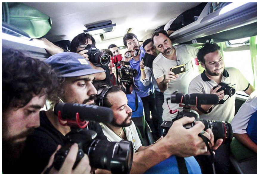
Figura 10: Jornalistas de mídias ativistas em cobertura coletiva.