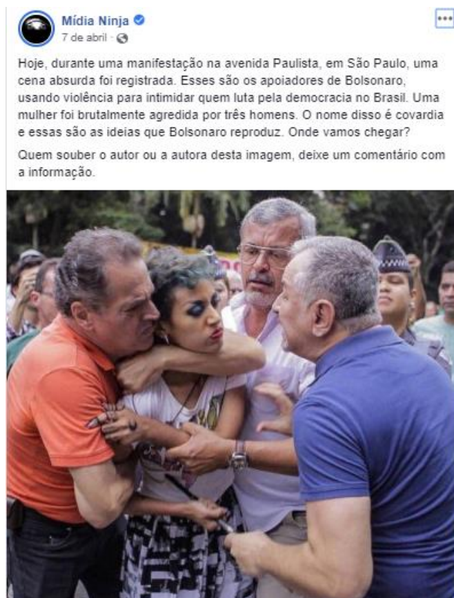
Figura 7: Manifestante sendo agredida em protesto.

No exemplo seguinte (Figura 7), a Ninja faz a cobertura de manifestações por ocasião de um ano da prisão de Lula, convocadas tanto em sua defesa quanto contrárias a este. Em São Paulo, uma manifestante pró-Lula é cercada por três homens pró-Lava Jato. Na publicação, a Ninja definiu: “O nome disso é covardia e essas são as ideias que Bolsonaro reproduz”.