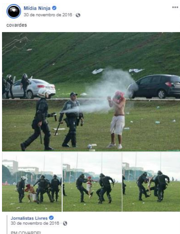
Figura 9: Mídia NINJA compartilha conteúdo do Jornalistas Livres em manifestação em Brasília.

No exemplo a seguir a Mídia Ninja compartilhou conteúdo do Jornalistas Livres , uma outra mídia ativista, no protesto Ocupa Brasília , de onde a Ninja tinha muitas imagens próprias, o que sugere que o compartilhamento ocorre menos por necessidade e mais para estimular a camaradagem que ajuda a formar o “nós” (Figuras 9).