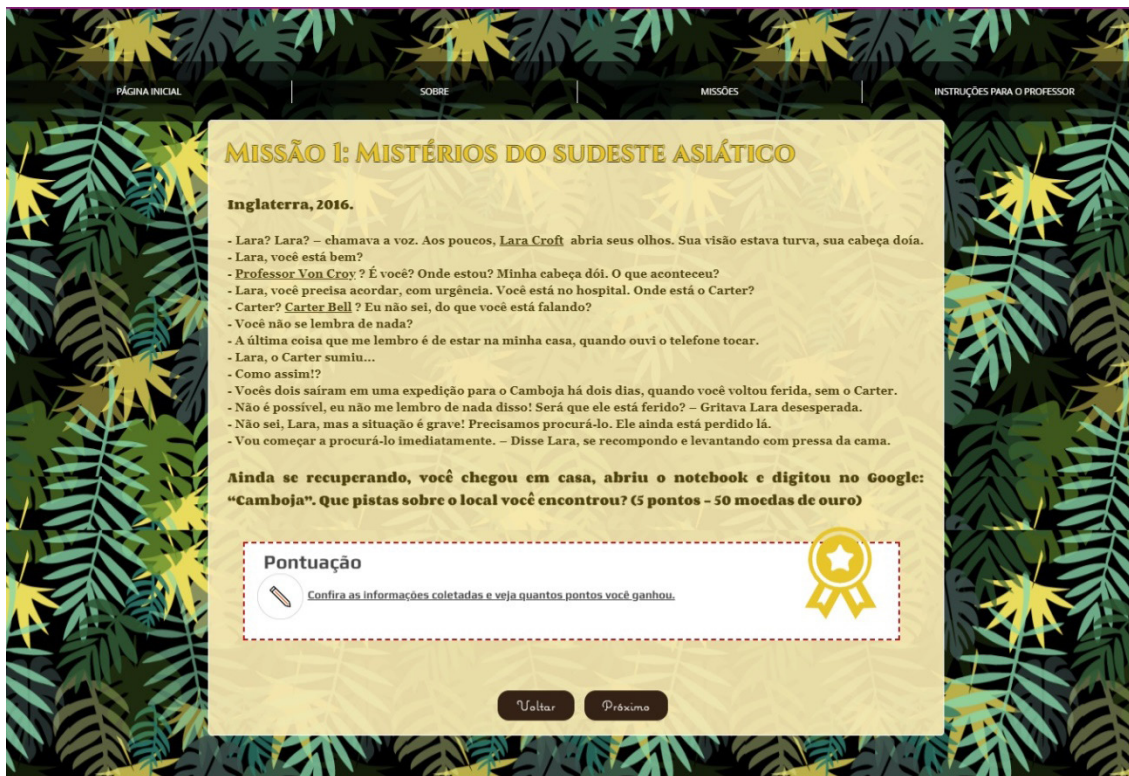
Figura 1. Aspecto visual do percurso gamer “Lara Croft nos templos do Camboja”.

Em relação ao tempo, assim como em um jogo autêntico, prevemos que o estudante poderia seguir as etapas de cada atividade em seu próprio ritmo, desvinculando-se das rotinas tradicionais de sala de aula. No entanto, para finalidades de organização do professor, um planejamento foi idealizado para a pesquisa, considerando-se aulas de 50 minutos, conforme demonstramos no quadro 1, a seguir.