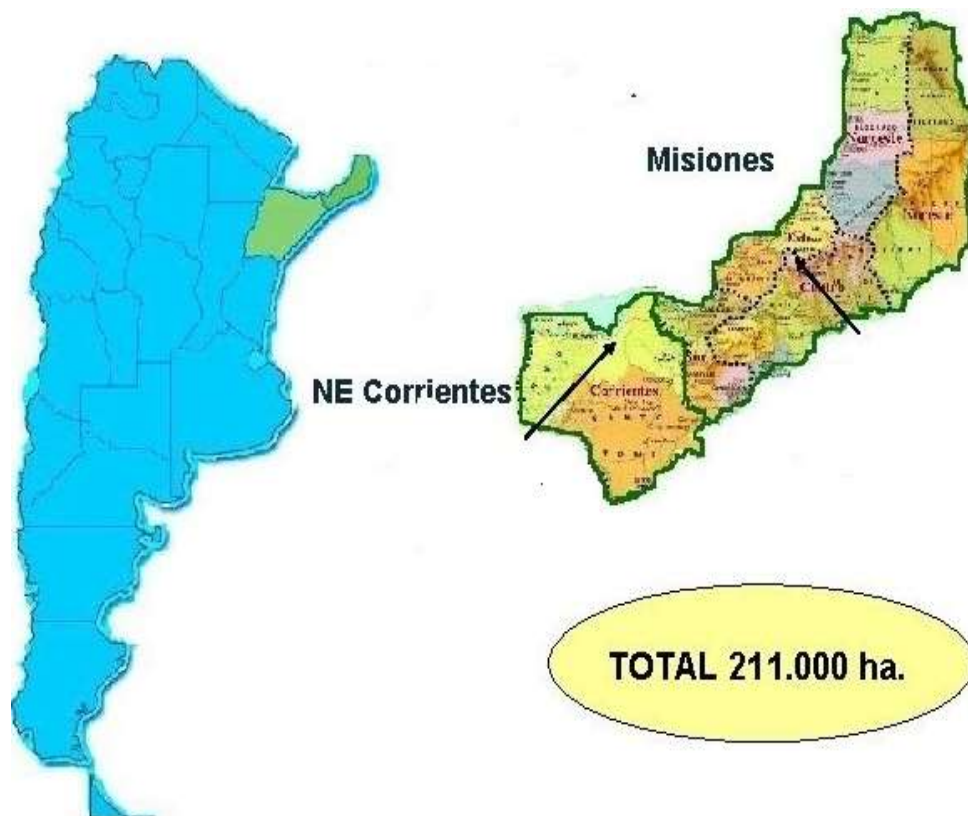
Figura 1: Zonas productoras de la yerba mate

Cultivada dentro de las misiones jesuíticas, con la decadencia de este sistema y la posterior dispersión de los pueblos guaraníes, la práctica de reproducción de yerba mate fue olvidada. Durante mucho tiempo, los yerbales naturales en existencia en Misiones, Paraguay y Brasil cubrieron las demandas regionales. Sin embargo, las prácticas inadecuadas de poda -en algunos