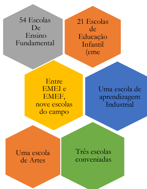
Figura 2- Organização das escolas municipais de Santa Maria/RS

Fonte: Elaborada pela autora (2022), conforme site da Prefeitura Municipal de Santa Maria.