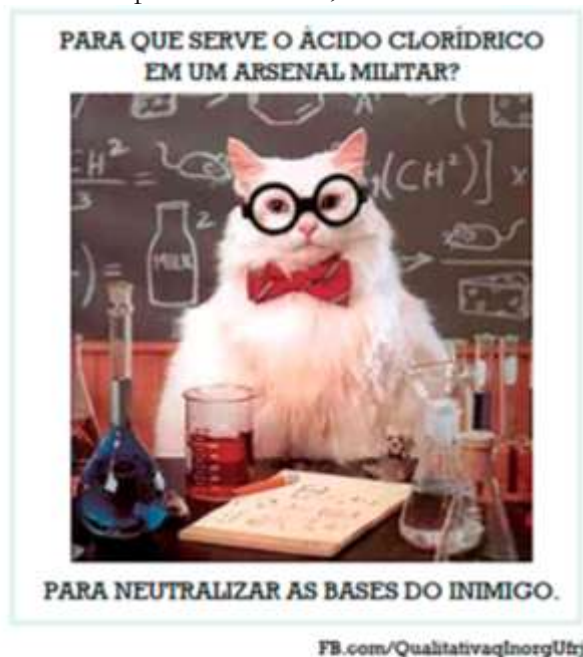
Figura 2 – Meme-1 presente na prova de 2ª fase, do exame discursivo de Química da UERJ 2016.

Considere que, no texto acima, as “bases do inimigo” correspondam, na verdade, ao hidróxido de bário.