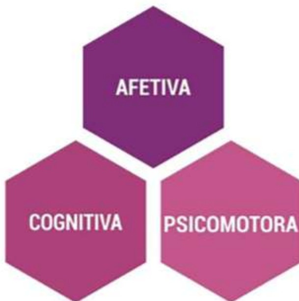
Figura 1 – Três áreas ou domínios da taxonomia de Bloom.

A existência de taxonomias nas várias áreas do conhecimento se deve aos estudos de um grupo de pesquisadores, coordenados pelo psicólogo e pedagogo americano Benjamin Samuel Bloom, na década de 1950, que culminou no sistema conhecido como Taxonomia de Objetivos Educacionais (TOE). A TOE pode ser definida como sendo uma “estrutura para classificar afirmações sobre o que se pretende que os estudantes aprendam como resultado da instrução (considerando os três domínios)” (LEITE, 2022, p. 62). Para Ortiz e Dorneles (2018), o processo de aprendizagem é bastante complexo e dispõe de inúmeras variáveis que, por sua vez, são difíceis de delimitar com exatidão. Todavia, “para fins didáticos, educadores e psicólogos delimitaram três áreas ou domínios nos quais ocorrem a aprendizagem, sendo eles: afetivo, cognitivo e psicomotor” (ORTIZ; DORNELES, 2018, p. 20), conforme a Figura 1, sendo eles, frutos da TOE.