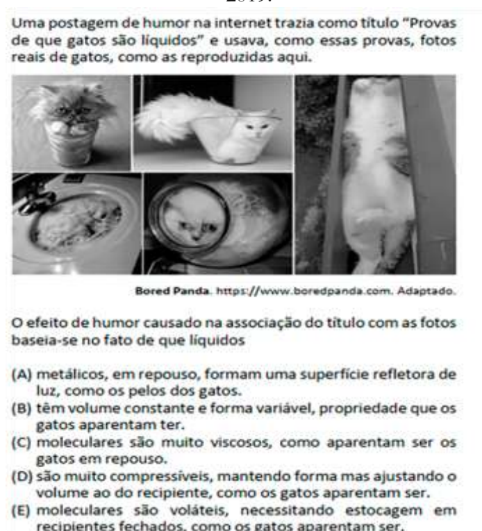
Figura 4 – Meme-3 presente na prova de conhecimentos gerais, 2ª fase, do vestibular da Fuvest/USP 2019.