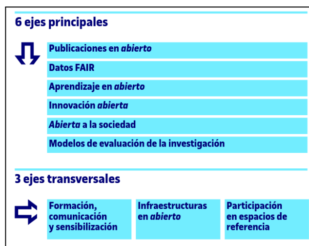
Figura 1. Ejes temáticos y transversales del Plan de Acción de Conocimiento Abierto de la UOC.

Tal como muestra la Figura 1 , el Plan resultante de todo este proceso, consta de 6 ejes temáticos, y 3 ejes transversales, cuyos objetivos específicos se definen con el horizonte temporal puesto en el 2030.