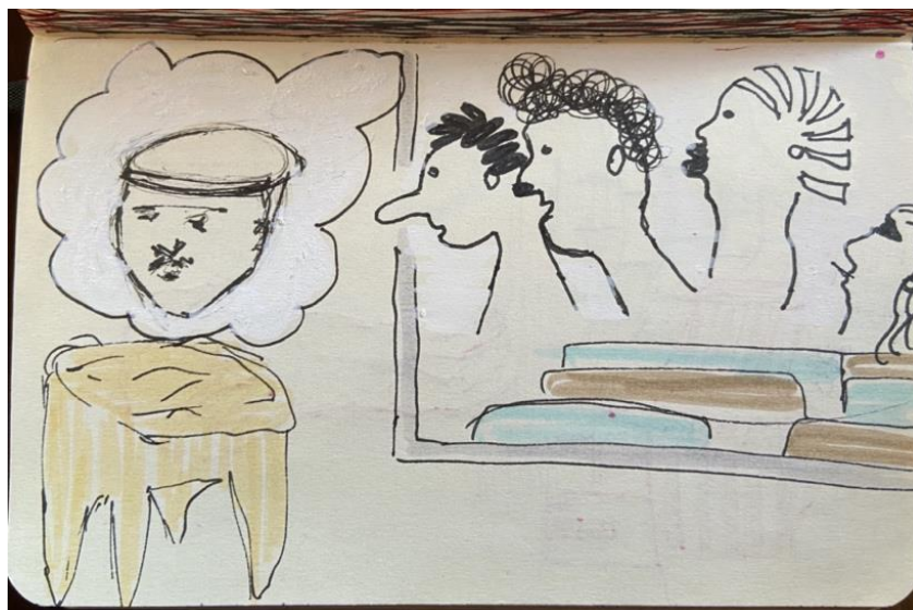
Figura 2: Desenho retirado de sketchbook de um arquivo docente