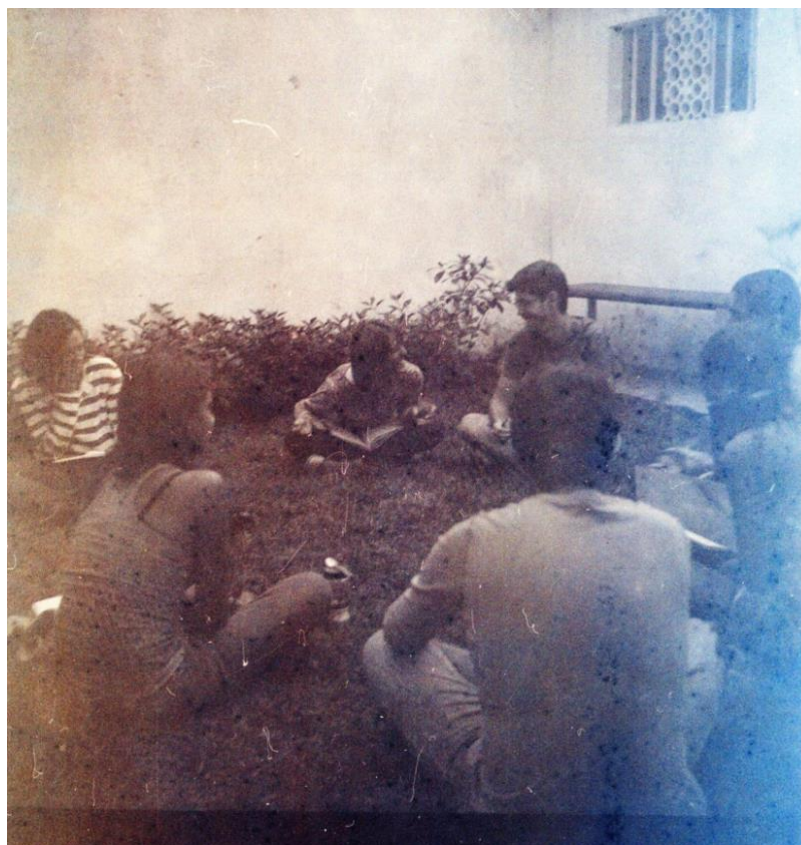
Figura 5: Registro fotográfico retirado de um arquivo docente

Ela balbucia rumores: Uma frase, uma imagem... Algo do arquivo. Aliás, voltar ao arquivo, ao encontro com o arquivo!