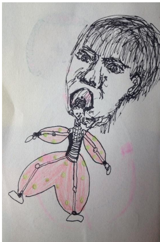
Figura 3: Desenho retirado de sketchbook de um arquivo docente

Uma fala sem palavra vibra. Um grito que silencia a voz e esbraveja no corpo. Que corpos a educação produz, com que corporeidades opera? Como compõem-se? O que produzem? Que engrenagens movimentam, quais órgãos? Quão impassíveis são suas articulações físicas e mentais? Como desacomodar corpos tão acostumados e adormecidos? Para onde e como voltarão os corpos da educação pós-pandemia covid-19? Passará? Voltarão?