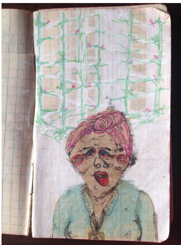
Figura 1: Desenho retirado de sketchbook de um arquivo docente

Como acontece o encontro na docência? Ou, como pensar e operar a docência como encontro (SPINOZA, 2010)? Contudo, qual a razão de ensaiar na presente escrita tais questões? Afinal, a aparição dessas duas palavras em proximidade parece óbvia, já que a docência pressupõe um encontro entre pessoas, geralmente entre os professores e os estudantes. O que, então, de interessante ou instigante pode produzir o problema de uma docência como encontro? Talvez hoje, no final do ano de 2022, após dois anos de pandemia da covid-19, o encontro na docência suscite provocações e pensamentos, já que o habitual ou o modo “normal” foi proibido durante esse período. O que forjou incômodos, diferenças e adaptações que, por vezes, irromperam invenções dos encontros na docência ao desacomodar as costumeiras interações entre professoras, professores, alunos e alunas.