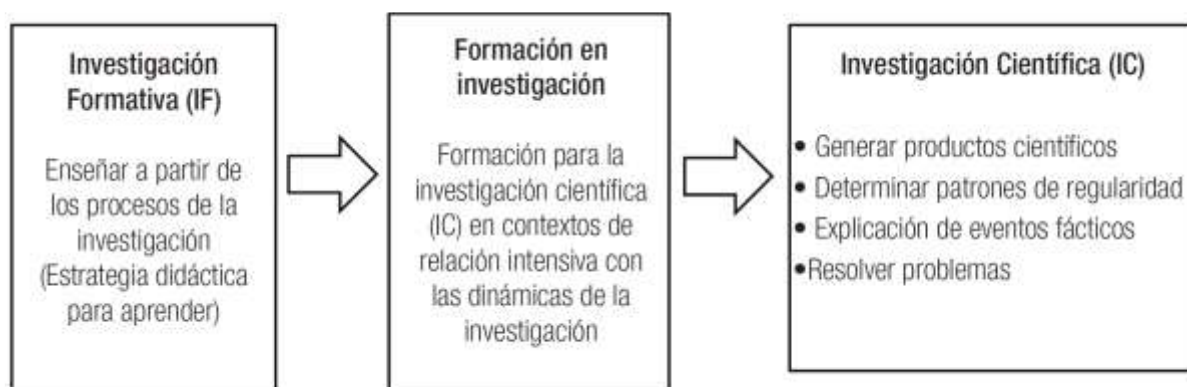
Figura 2. Integración de la investigación formativa con la investigación científica

Al respecto, Turpo-Gebera et al. (2020:13) entienden como demandas de los docentes a la investigación formativa, las competencias siguientes dentro del saber-conocer: capacidad de análisis, capacidad reflexiva y acceso a fuentes informativas. En cuanto a las habilidades o saber-hacer: experimentar y observar. Y en cuanto a valores o saber-ser: espíritu crítico y disposición para aprender.