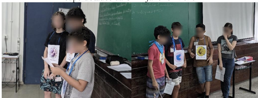
Figura 2 A e B Membros dos diferentes grupos apresentando a resolução do caso clínico durante o workshop Construindo ImunoJogos e Imuno Aplicativos – VIII Curso de Verão para alunos superdotados da UFF. Janeiro - 2020.

Os grupos expuseram aos demais o seu caso clínico, seguido da solução. Mesmo aqueles que estavam tendo contato com o assunto pela primeira vez, expuseram seus resultados e foram capazes de discorrer sobre os mesmos (Figura 2 A e B). Sendo assim, evidencia-se a importância de conhecer as potencialidades dos alunos com comportamento superdotado. Foi possível oferecer a este público-alvo da educação especial, uma atividade enriquecedora e com potencial para ser disponibilizada para toda a escola, segundo o Modelo de Enriquecimento para toda a Escola proposto por Renzulli (2014). Proporcionando a estes alunos o desenvolvimento máximo de suas aptidões e que conjuntamente descubram novas. Como também, os que não são inseridos no perfil da superdotação, tendo, portanto, a oportunidade de trabalharem a partir de uma metodologia de problematização (FREIRE, 1979).