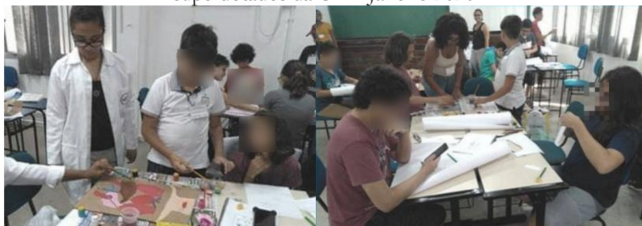
Figura 3 A e B Os estudantes participantes confeccionando um protótipo de ferramenta pedagógica durante o workshop Construindo ImunoJogos e Imuno Aplicativos – VIII Curso de Verão para alunos superdotados da UFF. Janeiro 2020.

Ao término do 1º dia de atividade foi solicitado que cada um dos participantes construísse uma proposta de um recurso didático para ser utilizado com métodos ativos de ensino nas escolas regulares. A ideia era auxiliar alunos superdotados ou não, a compreenderem o Sistema Imunológico e sua importância para a saúde individual e coletiva. Desta forma, no início do 2º dia de atividade, os participantes expuseram as suas propostas de ferramenta pedagógica. De acordo com as similaridades das propostas apresentadas, foram formados 4 grupos de 2 ou 3 alunos cada um deles, a exceção de um estudante que possui dupla excepcionalidade, autismo e superdotação, e optou por confeccionar a ferramenta pedagógica de forma individual (Figura 3 A e B). Cada grupo deveria discutir as opiniões individuais para a criação de um único protótipo do jogo.