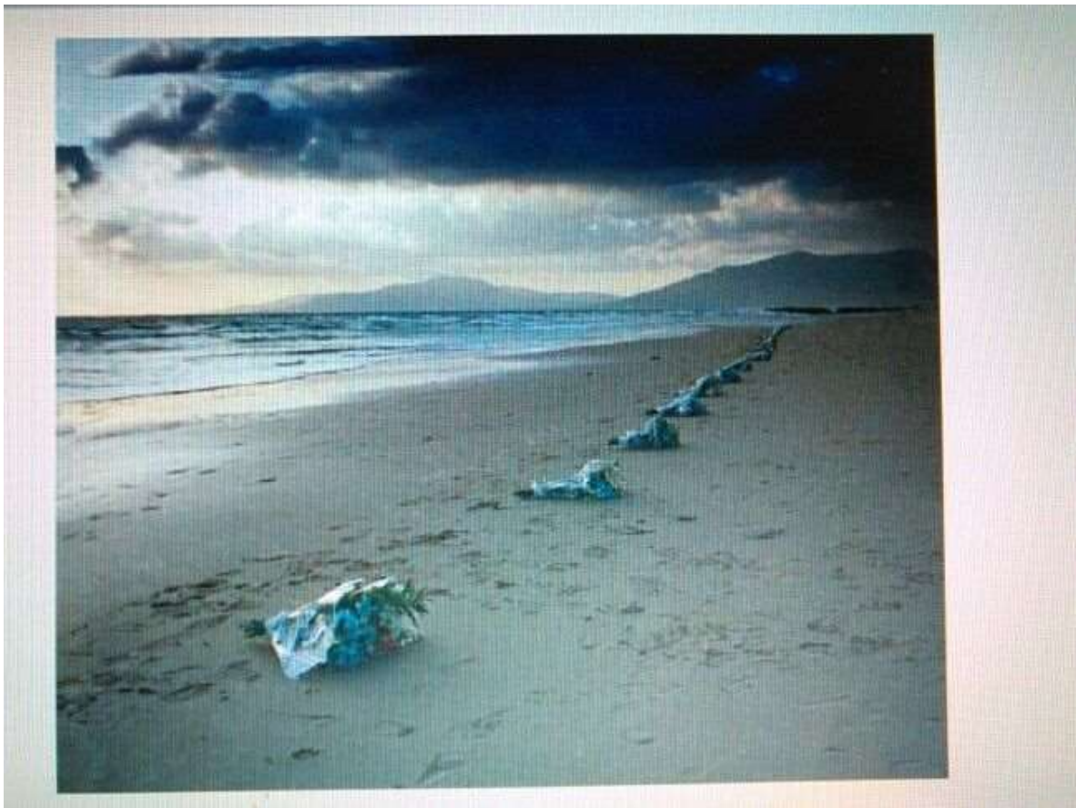
Figura 3: Jesús Rodríguez, Inmigrantes , La Rábida, 2001