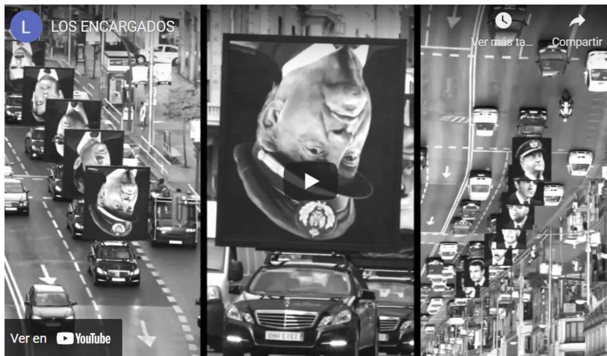
Figura 4: Santiago Sierra y Jorge Galindo, Los encargados, Gran Vía de Madrid. Enlace a video: https://youtu.be/QlIF0mwJe_I , consultado el 9/07/2022

Fuente: https://proyector.info/profile/los-encargados/ , consultado el 9/11/2021