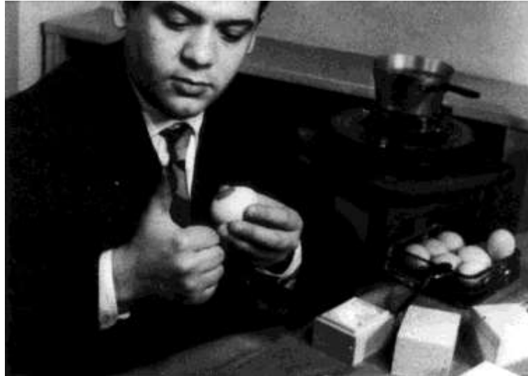
Figura 2: Consumición del arte dinámica del público: devorar el arte de Piero Manzoni (1960)