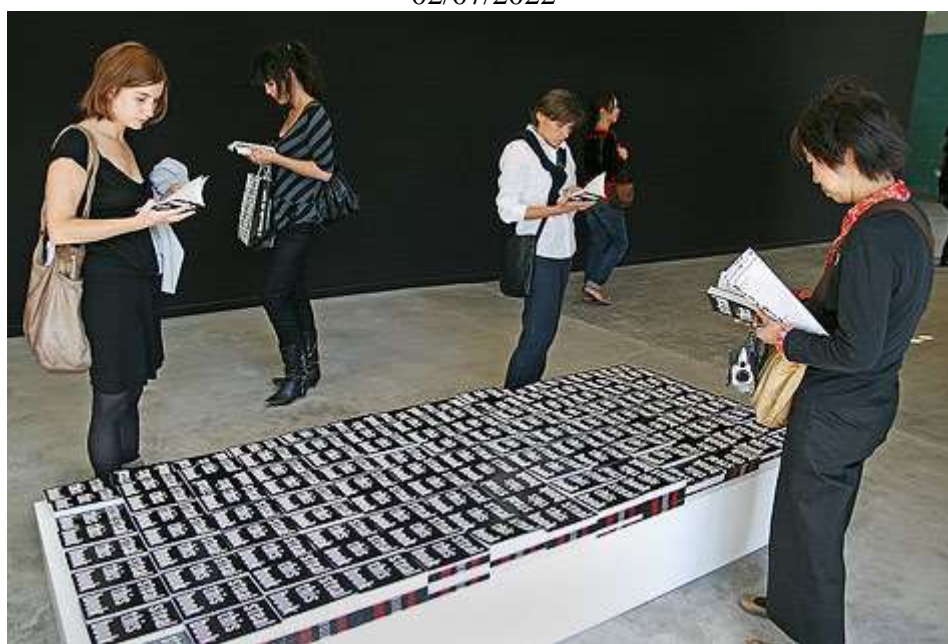
Figura 1: Dora García, Roba este libro, bienal de Lyon