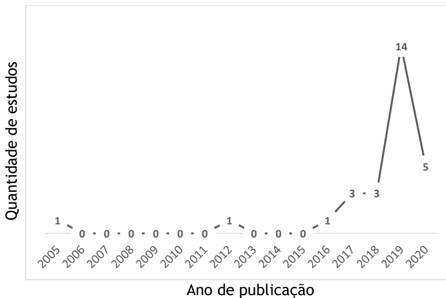
Gráfico 1. Distribuição dos estudos em relação aos anos de publicação.