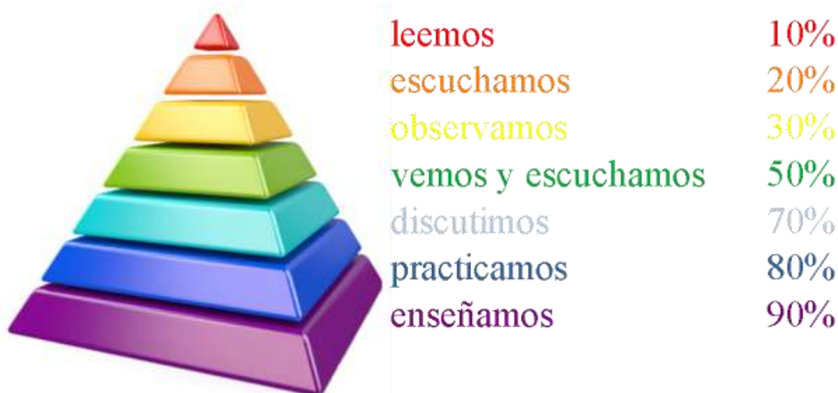
Figura 1: Elaboración propia a partir de la Pirámide de Glasser (2002)

La investigación se llevó a cabo a través de la comparación de los ítems utilizados en el entorno virtual de las asignaturas, según la descripción del objeto de estudio, con la teoría de Glasser (2002) y de la calificación de las actividades educativas según su capacidad de asimilación en el aprendizaje. Esta graduación permitió la creación de un ranking entre las tres asignaturas y la verificación de su evolución.