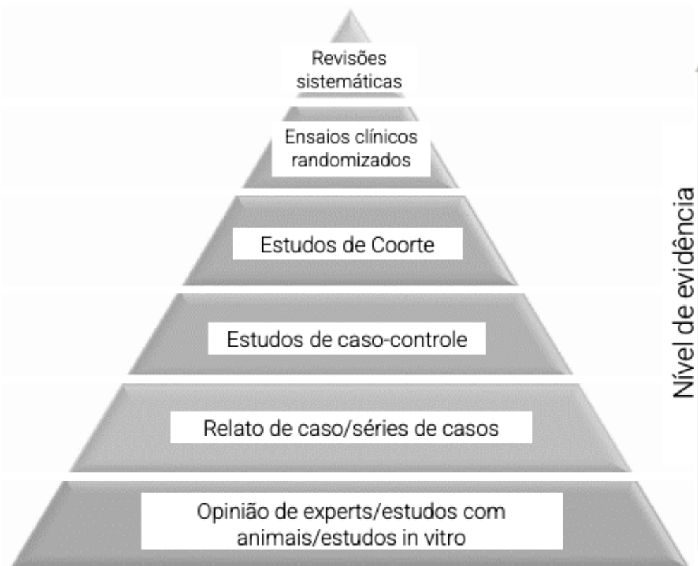
Figura 1. Pirâmide de Evidências.

A seguir, um pequeno esclarecimento sobre estes tipos de estudos, partindo da base da pirâmide: