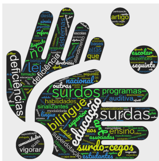
Figura 2 - Nuvem de palavras da Lei Nº 14.191 de 2021