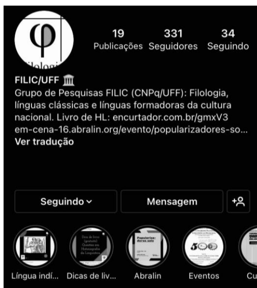
Figura 1. Página inicial (KALTNER, 2020a).

Note-se que a página apresenta em sua descrição a vinculação ao grupo de pesquisas FILIC/CNPq/UFF, utilizando o logotipo do grupo. Trata-se de uma página de caráter institucional, que serve também para a divulgação de livros gratuitos, de open source, para download e para a divulgação de eventos. Nesse sentido, a popularização busca integrar-se às ações extensionistas desenvolvidas pelo grupo de pesquisa.