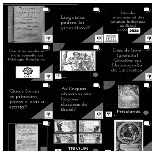
Figura 2. Layout (KALTNER, 2020a).

A segunda imagem apresentada é um apanhado do perfil no Instagram das postagens, demonstrando como o layout padronizado auxilia a criação de uma identidade visual. Geralmente, as postagens são organizadas em blocos sequenciais (carrossel), com cerca de 4 a 6 imagens que formam uma narrativa com início, meio e fim. Os blocos sequenciais de postagens precisam formar um significado único, a fim de que o seguidor precise ler o conjunto de mensagens para acompanhar a reflexão iniciada.