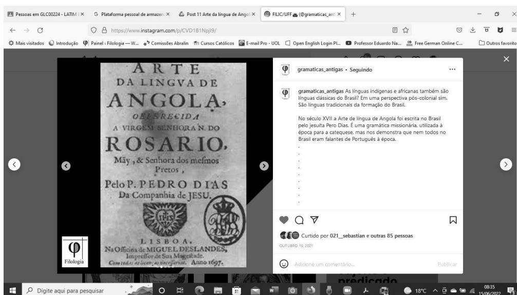
Figura 5. Arte da língua de Angola (KALTNER, 2020a).

Para exemplificar um documento que justifique esse debate, apresentamos a Arte da língua de Angola, de 1697, uma gramática da língua africana conhecida por quimbundo, muito falada no período colonial do Brasil, tendo sido a possível língua em uso no Quilombo dos Palmares. A gramática, escrita por um missionário jesuíta, é um dos documentos estudados pela Gramaticografia. Nossa apresentação do documento se dá por imagem tirada de edição digital, apenas da capa da obra, sem ingressar em tópicos específicos.