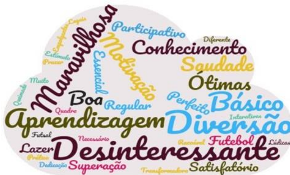
Figura 1 - Nuvem de palavras-chave agrupadas por repetição sobre as aulas de Educação Física no Ensino Médio