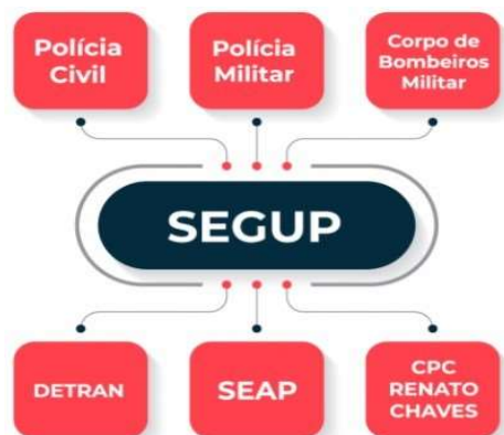
Figura 1 - Instituições Vinculadas à Segurança Pública do Pará.