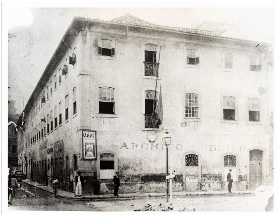
Figura 2 – Fotografia do prédio do Arquivo Público datada entre 1870 e 1907, na rua dos Ourives, n. 1, onde foi estabelecida a Escola Primária entre 1871 e 1874.

reduzido para apenas dois professores, um titular e um adjunto. Apenas na década de oitenta o número de professores seria novamente expandido, quando foi feita a contratação de mais um professor, totalizando três professores.