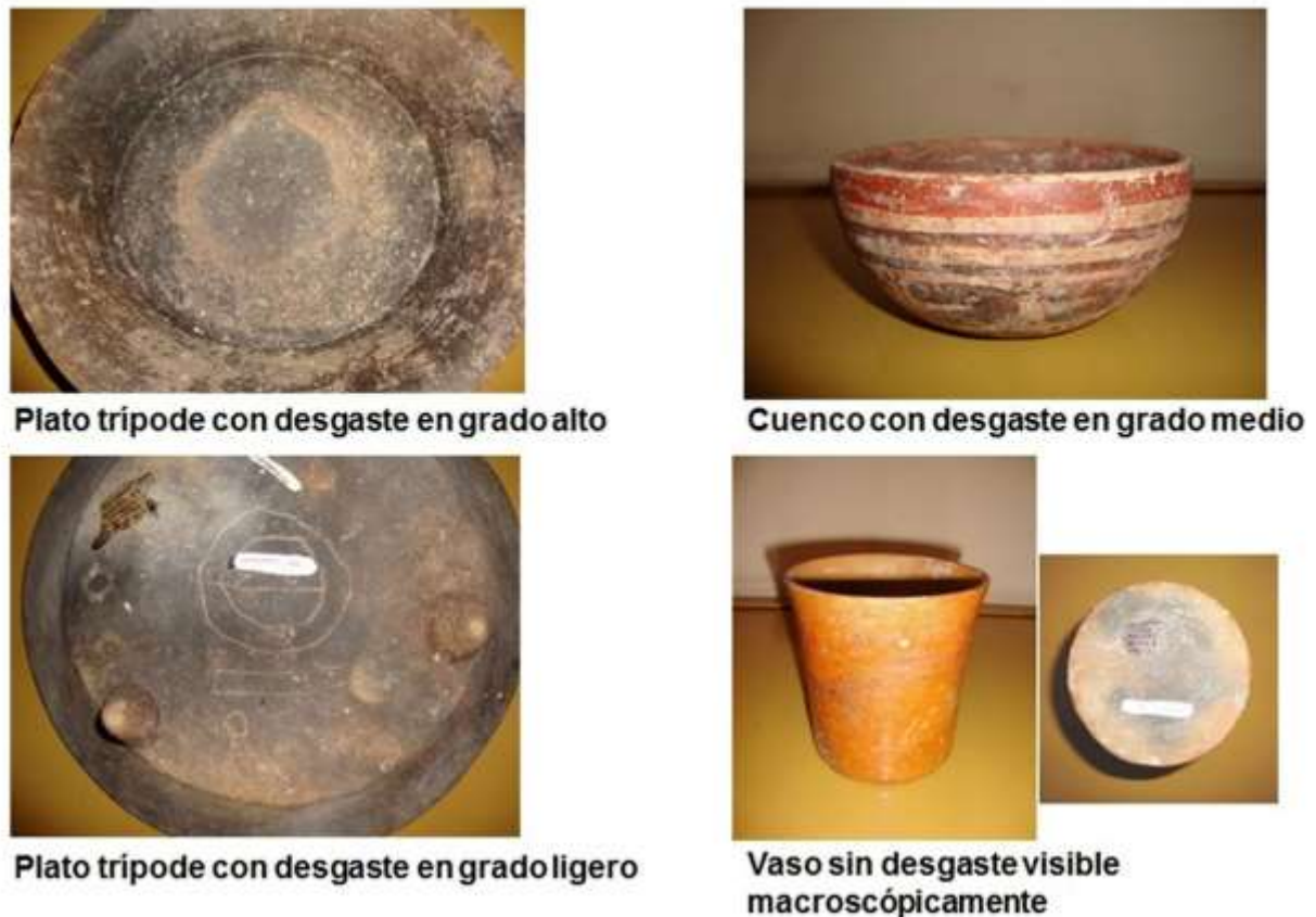
Figura 3: Grados de desgaste por uso en la colección de Yaxchilán