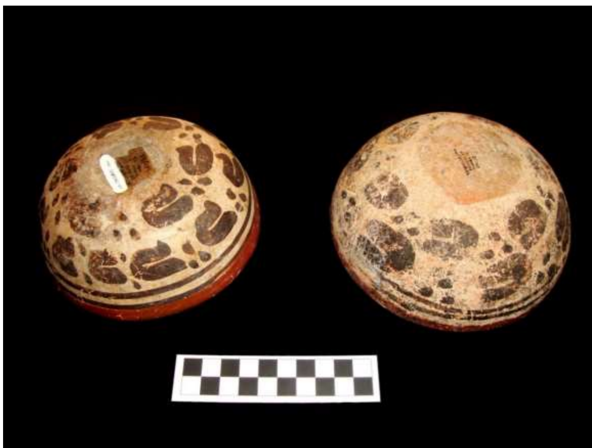
Figura 4: Cuencos con la decoración característica del tipo cerámico, y en este caso, sus bases rebajadas