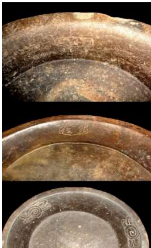
Figura 6: Pseudoglifos esgrafiados en el interior de los platos trípodes del tipo Zopilote negro manchado, variedad Inciso

Los platos de borde evertido horizontal suman un total de cinco y todos pertenecen a la variedad Inciso; en este tenor, con base en la información de las Tablas 3 y 4, los objetos 4, 13 y 21 comparten medidas y patrones decorativos muy similares, aunque en este último aspecto hay diferencias en torno a la clase de pseudoglifo, situación similar es la de los objetos 1, 3 y 9, aunando además que todas tienen diversos diseños esgrafiados en la base.