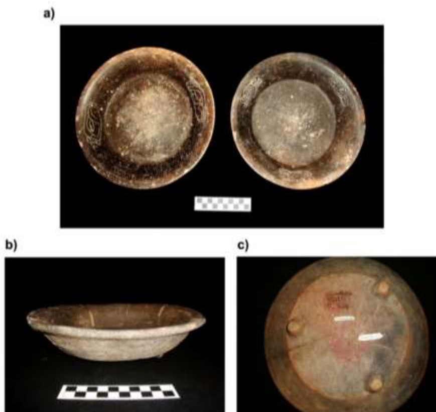
Figura 5: Platos del tipo Zopilote negro manchado: variedad Inciso (5a); variedad Zopilote (5b); variedad Inciso, con diseño esgrafiado en la base (5c)

El tipo Zopilote negro manchado se encuentra representado por platos trípodes con engobe café oscuro o negro, los cuales pueden presentar decoración (variedad Inciso) (Figura 5a) o carecer de ella (variedad Zopilote) (Figura 5b).