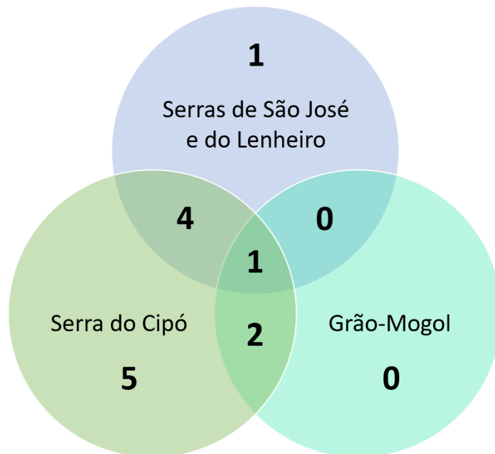
Figura 2. Diagrama de Venn demonstrando as relações entre as Serras de São José e do Lenheiro, Serra do Cipó e Grão-Mogol, Estado de Minas Gerais, Brasil, segundo a composição de espécies da família Orobanchaceae de cada uma das áreas.

Figure 1. Map showing the studied areas: Serra de São José and Serra do Lenheiro, Minas Gerais State, Brazil.