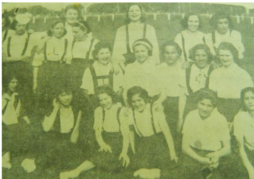
Ilustración 5. Alumnas del Colegio Secundario de Señoritas en encuentro de pelota al cesto.

En relación, justamente, a la administración y vigilancia de los cuerpos femeninos, en el informe de 1934, Rodríguez Jurado explica, sobre la indumentaria y la presencia, que “las alumnas deben ir a las clases con la cabeza descubierta, sin medias, calzadas con sandalias o zapatos sin tacos y flexibles; su ropa debe ser la usual de gimnasia” (BENIGNO RODRÍGUEZ JURADO, 1934, p. 15). Aquí se presentan elementos referentes a reglas de apariencia o regímenes de apariencia. Para los varones, simplemente aclara que deben acudir a las clases “provistos de un uniforme adecuado para la práctica de los ejercicios [y que] observan las reglas de higiene indispensables” (RODRÍGUEZ JURADO, 1935, p. 200). Esa justificación a partir del discurso higiénico del uso de uniformes diferenciados para las clases de gimnasia, presentaría razones morales vinculadas a la construcción de un universo diferenciado para varones y mujeres, respectivamente. Desde la lectura de la teoría queer, podemos ver cómo “la materialidad del cuerpo no permanece independiente de los discursos sociales” (MARTÍNEZ, 2015, p. 326). En palabras de Butler (2018, p. 18), “las normas reguladoras del «sexo» obran de una manera performativa para construir la materialidad de los cuerpos y, más específicamente, para materializar el sexo del cuerpo”.