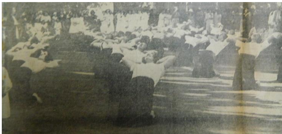
Ilustración 3. Exhibición de 1932. Diario "El Argentino" del 9 de noviembre de 1932.