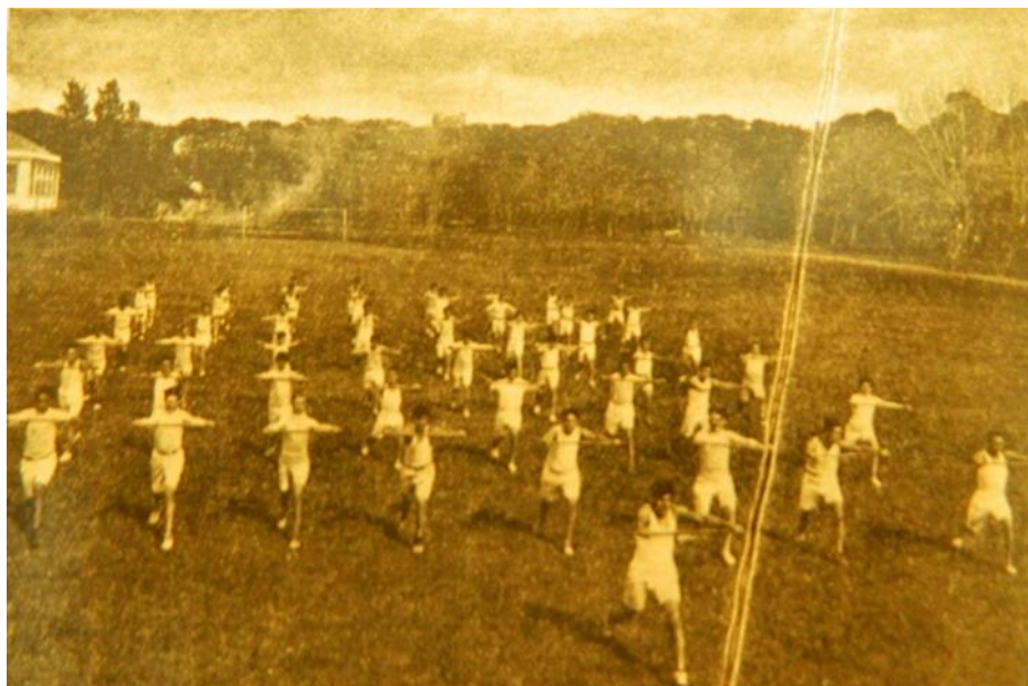
Ilustración 6. Alumnos del Colegio Nacional con sus uniformes. Rodríguez Jurado (1929)

De las fotografías, nos interesa destacar también la apariencia de las mujeres en relación a su cabello recogido. Siguiendo a la historiadora feminista francesa, Michelle Perrot (2009: 41),