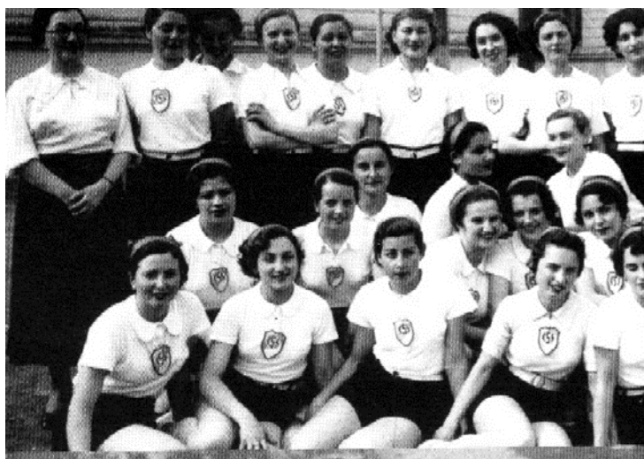
Ilustración 9. Alumnas con uniforme de gimnasia. 1937.

Los bombachudos o pantalones cortos utilizados por las alumnas son una vestimenta que, claramente, se acerca a la presentada por los alumnos (lo que indicaría cierta igualdad entre unas y otros) y posibilitan mayor libertad en los movimientos, a la vez que permiten la exhibición de las piernas de las mujeres, a diferencia de las largas polleras utilizadas los años anteriores. No obstante, entre las reglas de apariencia se evidencia la obligatoriedad de continuar llevando el cabello recogido, lo que, como se dijo, en ese momento se ligaba al erotismo (a no despertar en el otro sentimientos indecentes en el espacio público), el pecado e, incluso, a la prostitución. Además, podría inferirse que, a partir de la exhibición de las piernas de las mujeres, sus cuerpos se están construyendo para el deseo del hombre heterosexual.