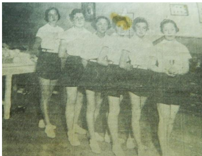
Ilustración 7. Alumnas de 5° año posando luego de competir en pelota al cesto. El Plata, 8 de noviembre de 1935.