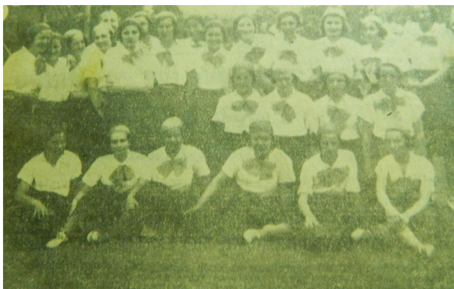
Ilustración 4. Alumnas del Colegio Secundario de Señoritas. 1934.

La feminidad en ese momento, como se ve en la ilustración 4, se definía también por el uso de detalles como moños, en consonancia con la vestimenta de las mujeres en la región, al menos, desde el siglo XIX (CHÁVEZ GONZÁLEZ, 2016). Entonces,