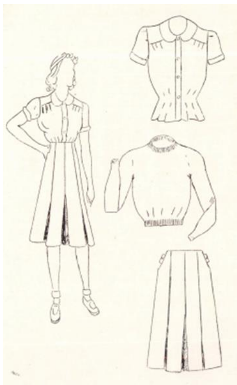
Ilustración 11. Uniforme obligatorio para profesoras y alumnas de Educación Física establecido por el Ministerio de Justicia e Instrucción Pública de la Nación. Boletín 1939, año 2, nº6.

Destacamos la referencia a que la pollera no sea transparente, lo que entendemos en el sentido de cierto temor a mostrar determinadas partes del cuerpo de la mujer. Es decir, identificamos en este tipo de alusiones la intención manifiesta de ocultar ciertas partes de los cuerpos de las mujeres.