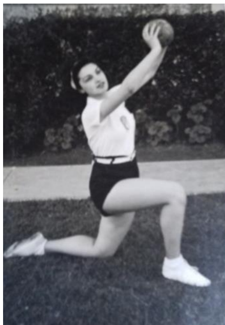
Ilustración 10. Alumna con uniforme de gimnasia. 1937.

En la memoria de 1936 se plantea que la directora del colegio ha adoptado un nuevo modelo de delantal blanco para el uso diario de sus alumnas que hará obligatorio para el curso de 1937 (CORTELEZZI, 1937). En un libro conmemorativo sobre el Colegio Secundario de Señoritas, se afirma que