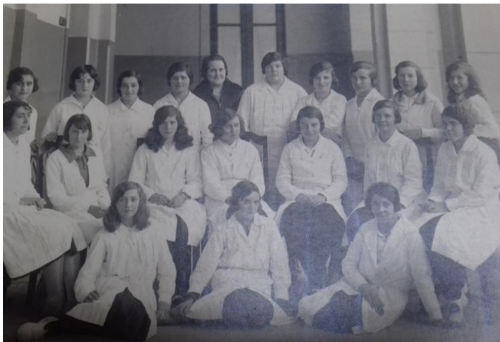
Ilustración 1. Uniforme de las alumnas del Colegio Secundario de Señoritas. Primeros años de la década de 1930.