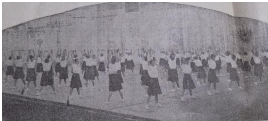
Ilustración 12. Diario El Argentino. 8 de noviembre de 1946. Exhibición de Educación Física donde las alumnas usan la pollera-pantalón y la blusa mencionadas.

De este modo, asistimos a una regulación de los cuerpos en pos de una igualación (al interior de los grupos de alumnos y alumnas, respectivamente), al mismo tiempo que se busca una diferenciación entre cada grupo.