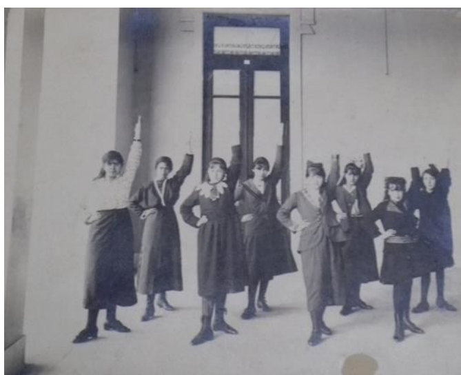
Ilustración 2. Alumnas del Colegio Secundario de Señoritas en clase de ejercicios físicos. Sin fecha. Por tratarse del edificio del Colegio Nacional, la foto sería anterior a 1931.