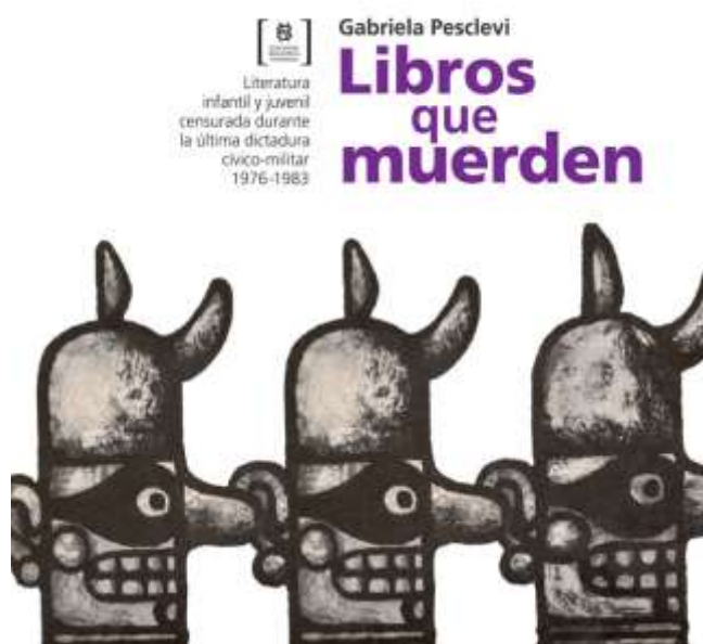
Figura 3: Programa Libros que muerden

A través de una colección de literatura heterogénea y diversa, la comprensión de la memoria de la violencia política puede ser abordada, el reconocimiento de la función social de las LEO en una experiencia como esta está completamente viva y a disposición no solo de la sociedad argentina sino del mundo entero, pues el lenguaje como artilugio compartido permite acercarnos al horror de la guerra, de la violencia, para concientizarnos de que otras formas de organización social son posibles.