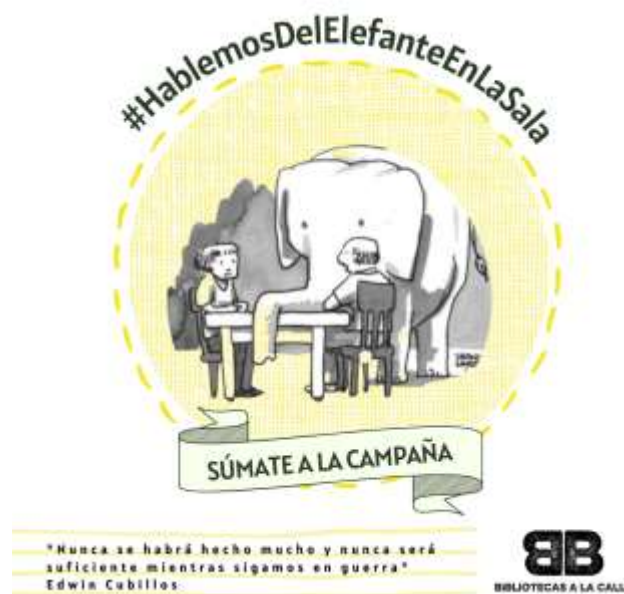
Figura 4: Programa del Elefante en Sala

Esta campaña ha congregado la palabra en múltiples formas y formatos y ha presentado alternativas para hablar de lo innombrable mediante el arte y la literatura. La intención de la campaña del Colectivo Bibliotecas es aportar al cuidado y defensa de bienes colectivos como la cultura y la educación a través del conocimiento de hechos sociales que parecen pasar desapercibidos pero que realmente se presentan socialmente y evadimos de manera constante.