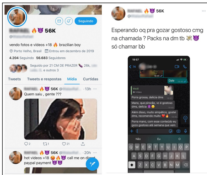
Figura 5 – Visibilidade e Mercantilização

Ao criar seu perfil, cada sujeito imediatamente se interroga como quer ser visto. Para Miskokci (2017, p. 244), “a construção de um perfil on-line busca responder a essa questão. A resposta é variável não apenas segundo cada indivíduo, mas sobretudo de acordo com o segmento erótico no qual se insere”. O @perfil10, na Figura 5, usa uma descrição clara quanto ao objetivo de seu perfil: vender fotos e vídeos para maiores de 18 anos e, na sua apresentação visual, dá indícios de que a compra é garantida, já que faz questão de postar os comentários de um possível comprador quanto ao material que recebeu na aquisição do pack .