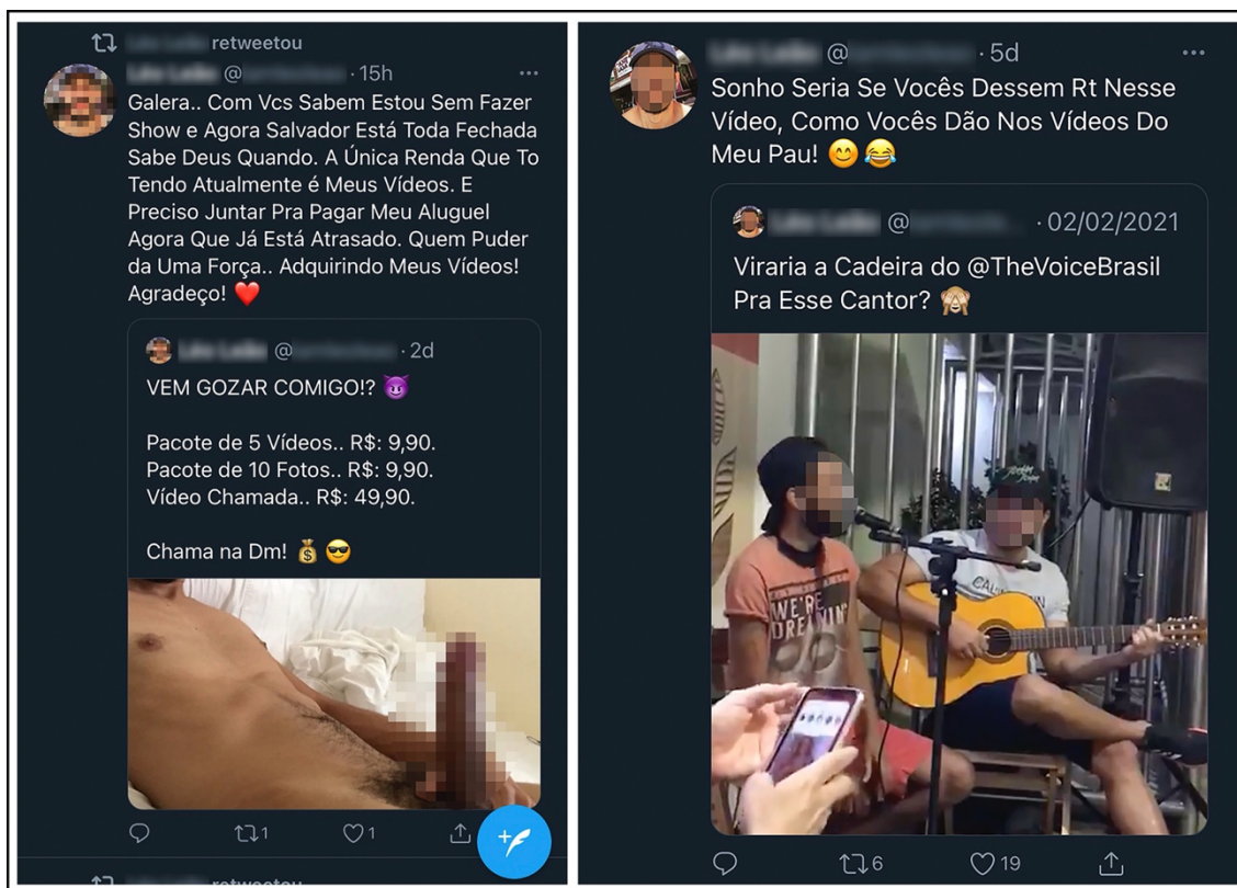
Figura 6 – Visibilidade

o aspecto profissional não é o que os usuários buscam. Com muitos conteúdos eróticos, profissionais ou amadores, disponíveis no Twitter , parece que poucos estão dispostos a pagar por um conteúdo complementar, o que revela pouco engajamento dos seguidores. Na postagem, o @perfil6 retoma um vídeo em que está cantando e faz um apelo à sua audiência: “Sonho Seria Se Vocês Dessem Rt 3 Nesse Vídeo, Como Vocês Dão Nos Vídeos Do Meu Pau!”. É o que vemos na Figura 6.