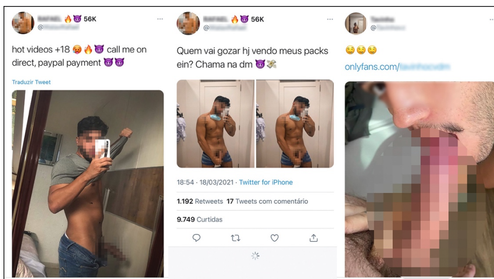
Figura 4 – Ver em segredos

Em outros perfis, talvez a propaganda seja de fato a alma do negócio e expor o órgão sexual é apenas uma das possibilidades de atrair mais seguidores e conquistar um número cada vez maior de curtidas e pagantes no Onlyfans . Nos perfis abaixo, as imagens não só são explícitas como também nos propõem a continuidade, mas para isso é preciso adquirir o pack . O @perfil10, nas duas primeiras imagens, pode levar o usuário a querer de fato se masturbar vendo seus vídeos. Inclusive, o próprio ambiente, que denota ser um quarto no primeiro e um vestiário no segundo, já confere uma ação privada e/ou proibida, que estimula ainda mais a imaginação. E na terceira imagem, o @perfil9 mostra imagem de sexo oral, mas seu olhar está direcionado para as lentes da câmera e passa a ideia de que nos olha/nos deseja. No imaginário, também nos deslocamos para o lugar da pessoa que está recebendo ou oferecendo o sexo oral, podemos ocupar o lugar de um ou de outro, como podemos observar na Figura 4.