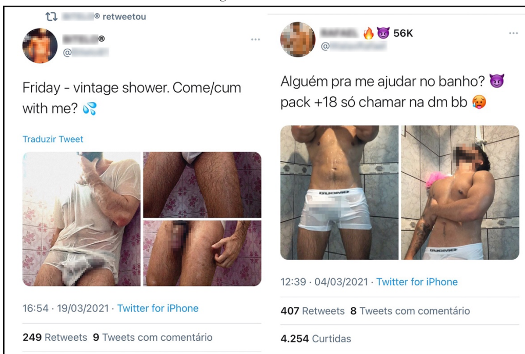
Figura 1 – O banho é uma festa

Vivemos a era do triunfo do corpo e de muitas maneiras ele é festejado em toda parte. Segundo Couto (2015b, p. 11), o corpo é o desejo que desperta desejo, “tudo nele flutua em torno de processos de sedução”. E como objeto de sedução que o corpo circula nas telas e, no caso específico, no Twitter . Nos perfis estudados a estratégia de visibilidade mais recorrente é da exibição do corpo em performances de banho. Em várias publicações, homens gays vestindo cuecas brancas e transparentes exigem o corpo e os contornos do pênis. Nessas narrativas, o pênis quase sempre ereto está sempre em destaque, como podemos observar na Figura 1: