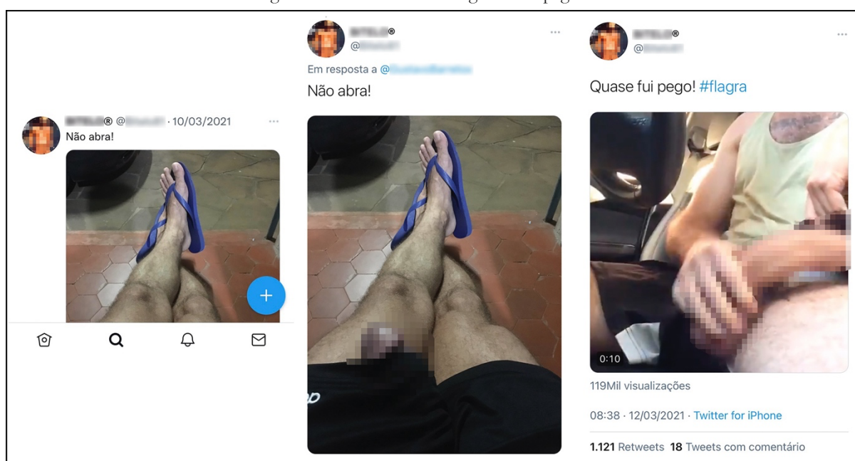
Figura 7 – Entre o consumo gratuito e pago

O mesmo ocorre na terceira imagem, que faz parte de print de um vídeo do @perfil1. Ele afirma na descrição “Quase fui pego! #flagra”. Ele está dentro de um carro, o que também aparenta ser um espaço privado, e mais uma vez cria possibilidades de mexer com a imaginação de seu seguidor dando condições de realmente querer ter sido pego no flagra e de se colocar “em perigo”, o que pode se tornar o momento ainda mais excitante. Estes três exemplos podem ser conferidos na Figura 7.