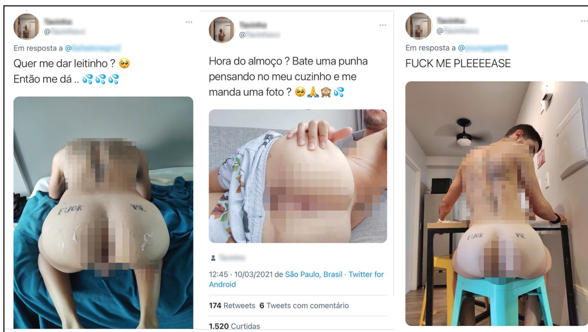
Figura 2 – Performances anal

Já nas imagens na Figura 2, o @perfil9 expõe suas fotografias e é nítido o apelo erótico. Tal comportamento, segundo De Carli (2007, p. 140), “aproxima o espectador dos protagonistas num contato quase tátil com a cena, que, na imaginação, seria privada, funcionando então como pulsão esópica do voyeurismo”. É notório o jogo de sedução que as próprias imagens são produzidas. Nela, o próprio sujeito traz consigo sua marca, imagens centradas no ânus, como objetificação sexual: “FUCK ME” – uma tatuagem que simboliza o convite a um determinado tipo de prazer sexual.