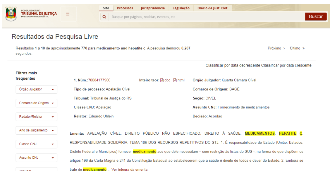
Ilustração 2 – Resultado da pesquisa de jurisprudência